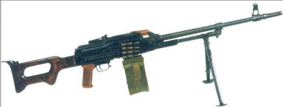
Ручной пулемет РПК

Помимо знаменитого автомата Михаил Тимофеевич также разработал: ручной пулемет РПК, танковый пулемет ПКМТ, охотничий карабин «Сайга»