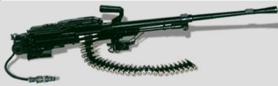
Танковый пулемет ПКМТ