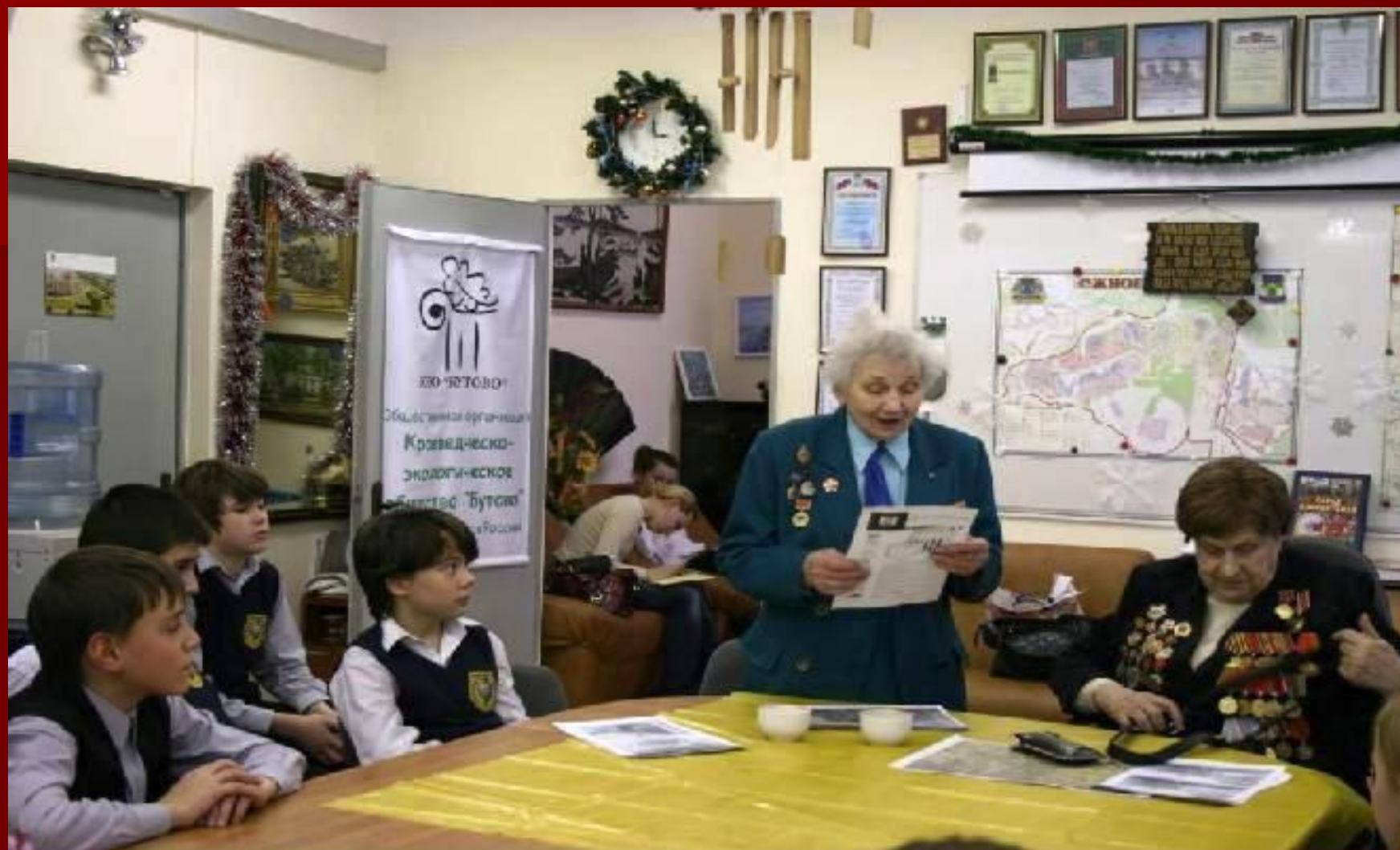
Встреча в музее с ветеранами-зенитчицами