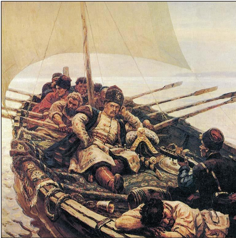
«Степан Разин». Художник В.И. Суриков. 1907–1910 гг.