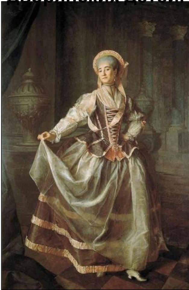
Воспитанница Смольного института

В России появилось более 60 закрытых дворянских учебных заведений , где обучалось около 4,5 тыс. дворянских детей.