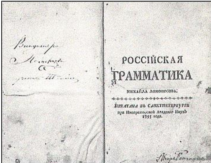
Учебник грамматики, разработанный М.В. Ломоносовым