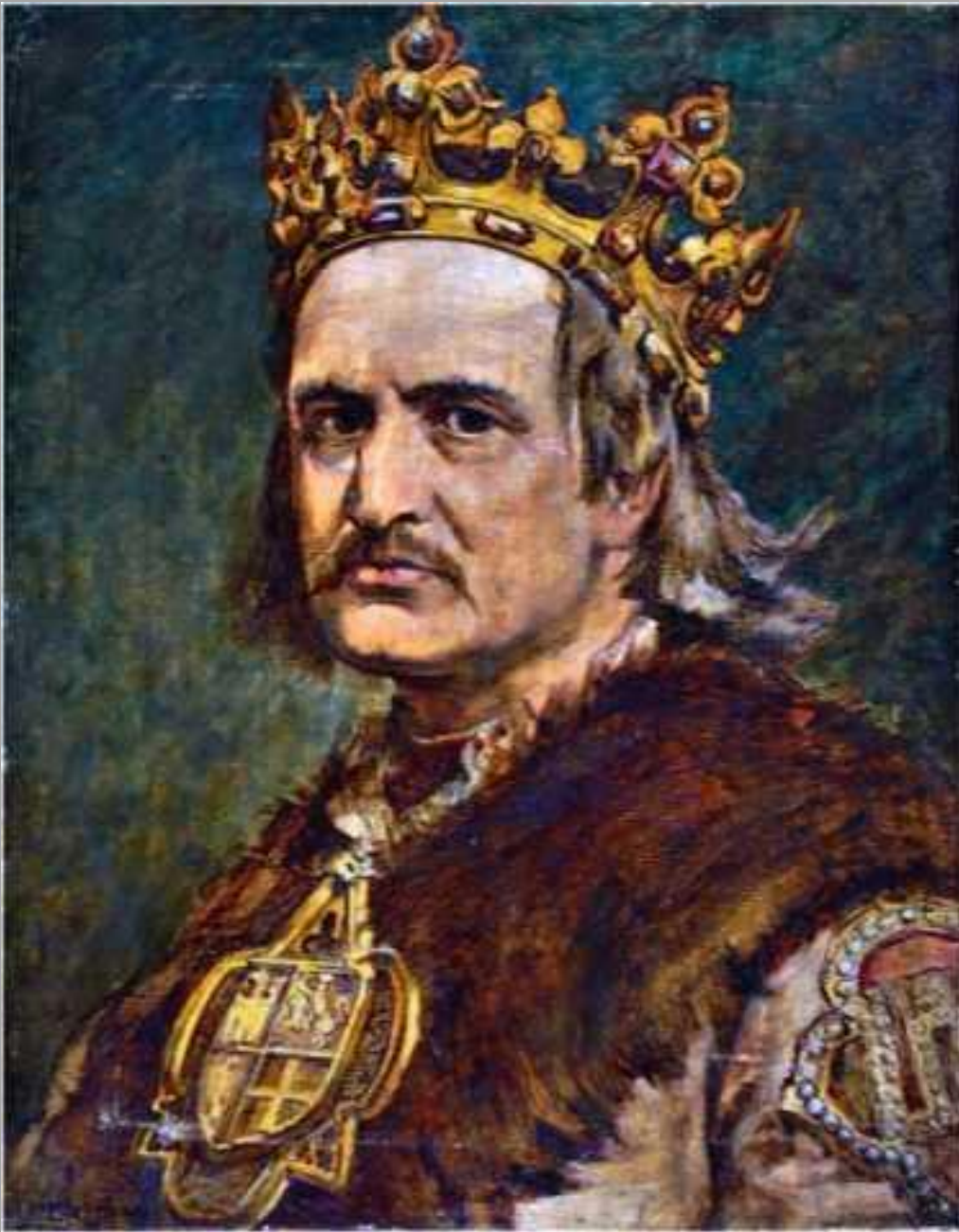
ЛИТОВСКИ Й КНЯЗЬ Ягайло