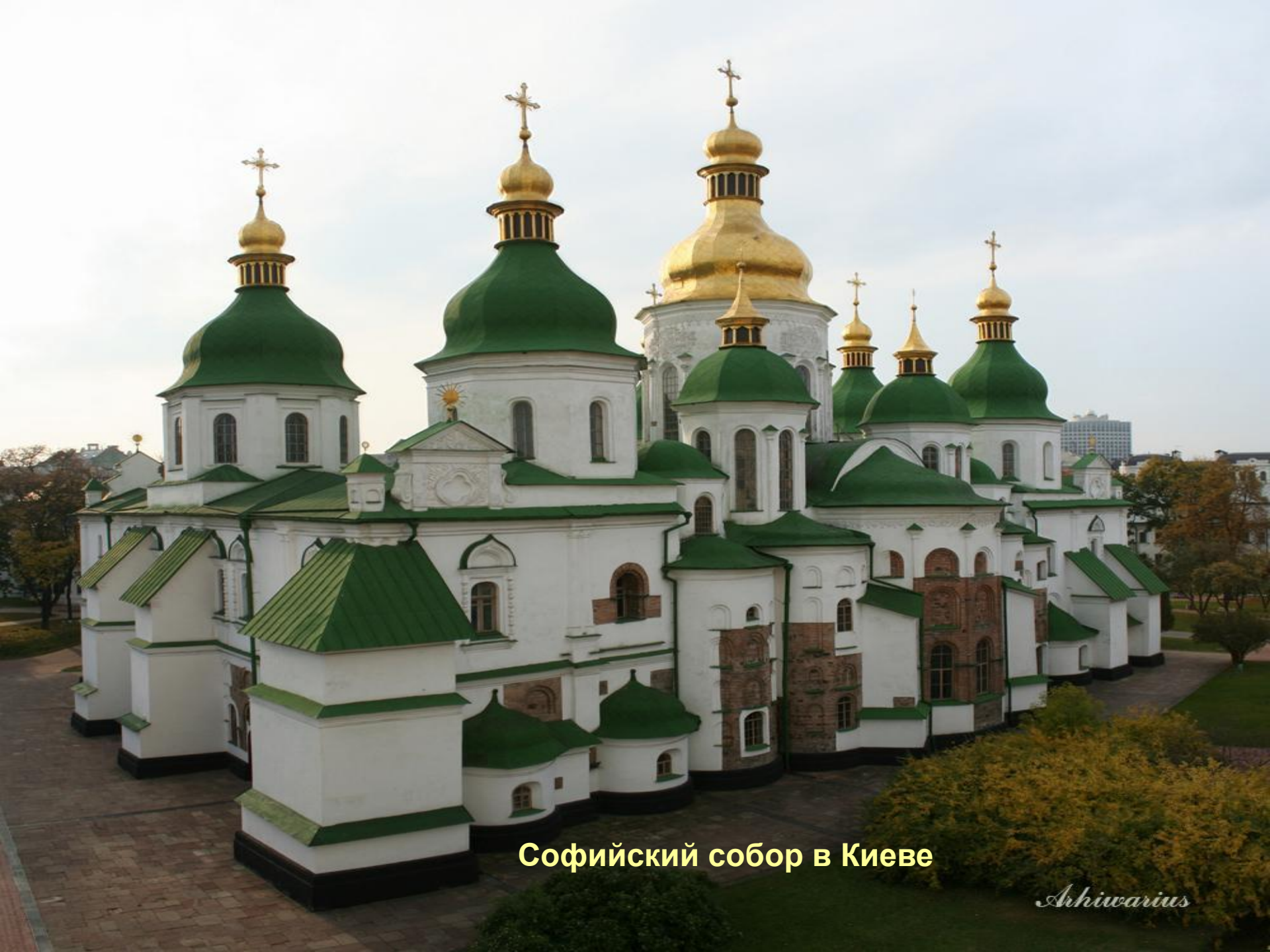
Софийский собор в Киеве