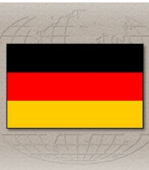
Вильгельм II. Последний император Германской империи.