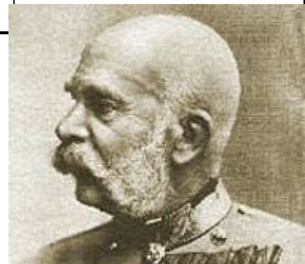
Франц Иосиф I Габсбург.