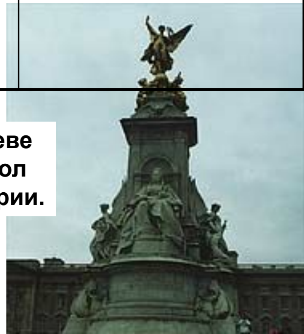
Памятник королеве Виктории. Символ Британской империи.