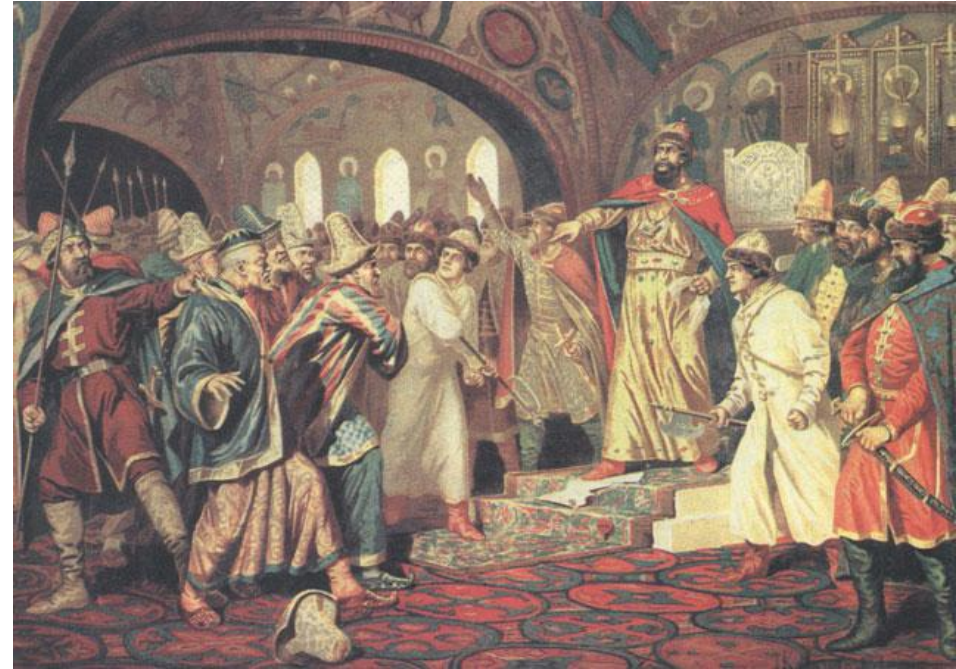
Кившенко А. «Иван III разрывает ханскую грамоту перед татарскими послами»