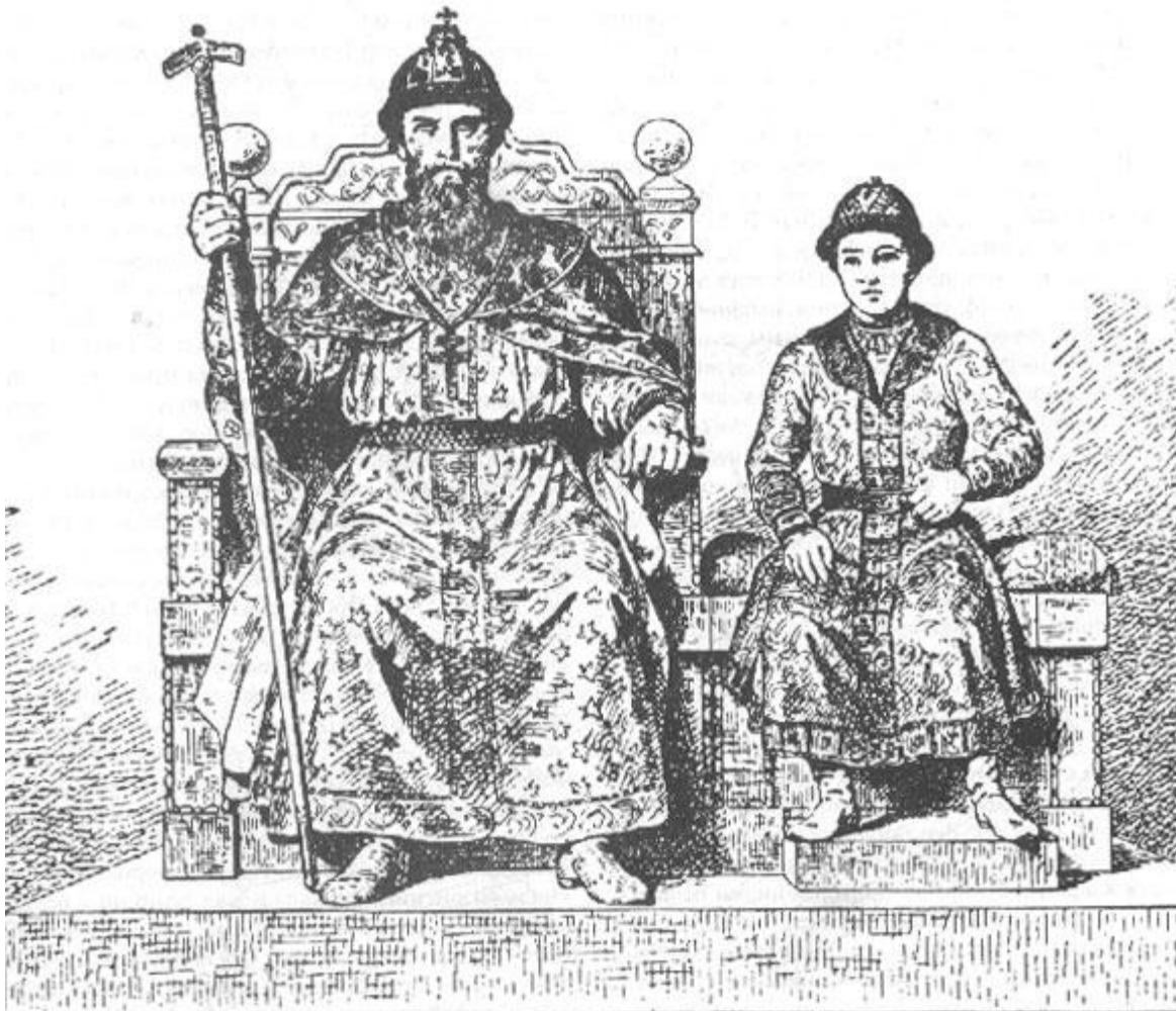
«Василий II Темный и его сын Иван» Неизвестный автор

Василий II понимал все опасности конкурентной борьбы за власть в Московском княжестве.