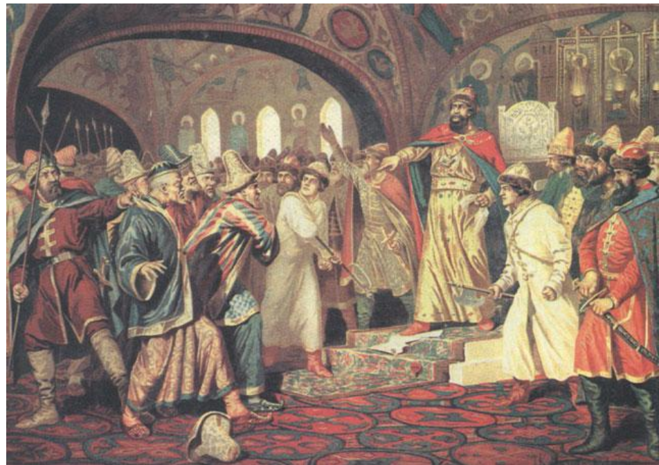
Кившенко А. «Иван III разрывает ханскую грамоту перед татарскими послами»