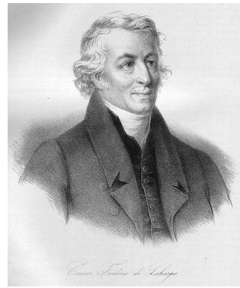
Вверху: Александр I Внизу: Екатерина II, Павел I, Фредерик Лагарп