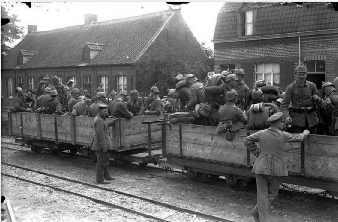
Bundesarchiv, Bild 104-0332 Foto: o. Ang. | 1914/1915 ca.