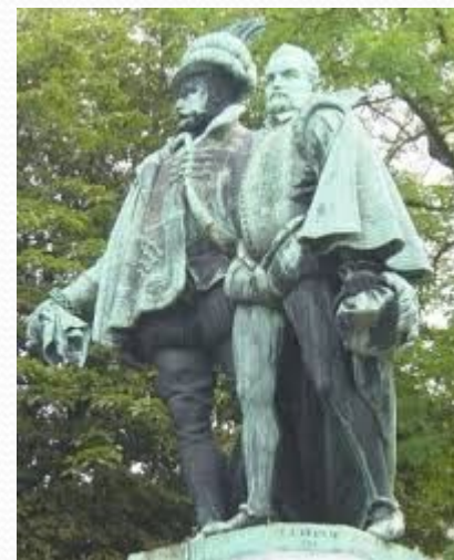
Адмирал Горн и граф Эгмонт