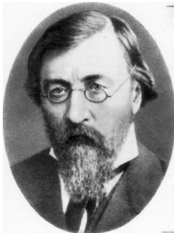
Н. Г. Чернышевский