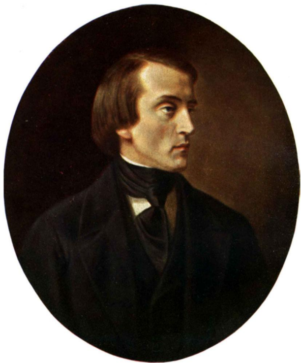
В. Г. Белинский

В 40-60-е г. XIX в. вклад в его становление внесли представители революционно-демократического направления В.Г. Белинский, Н.А. Добролюбов, Н.Г. Чернышевский.