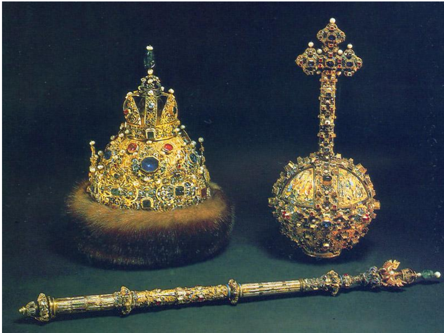
Символы самодержавия в России