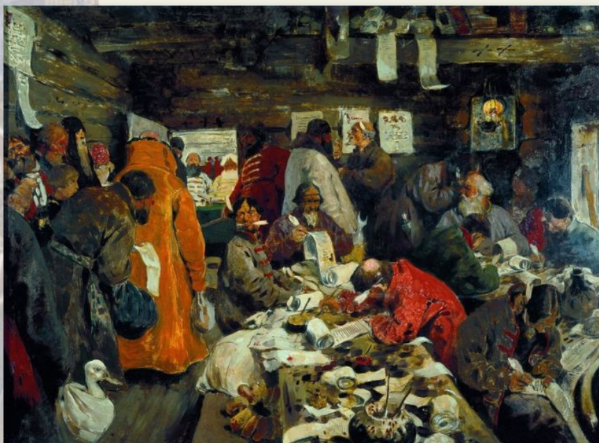
В приказе Московских времен. С.В. Иванов.