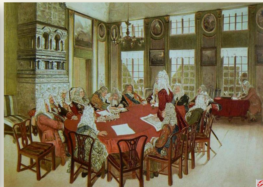
Заседание коллегии при Петре I. Д. Кардовский.