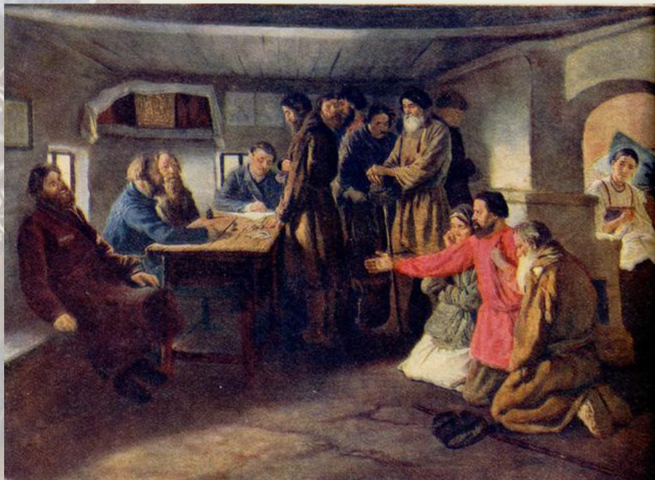
Сбор податей. Трутовский К. А.