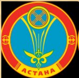
Герб города Астаны