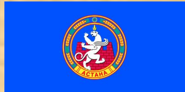
Флаг Астаны (1998—2008)