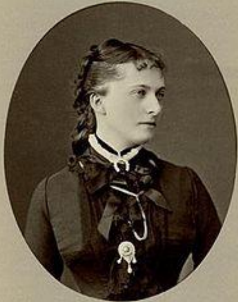
Портрет Екатерины Долгоруковой