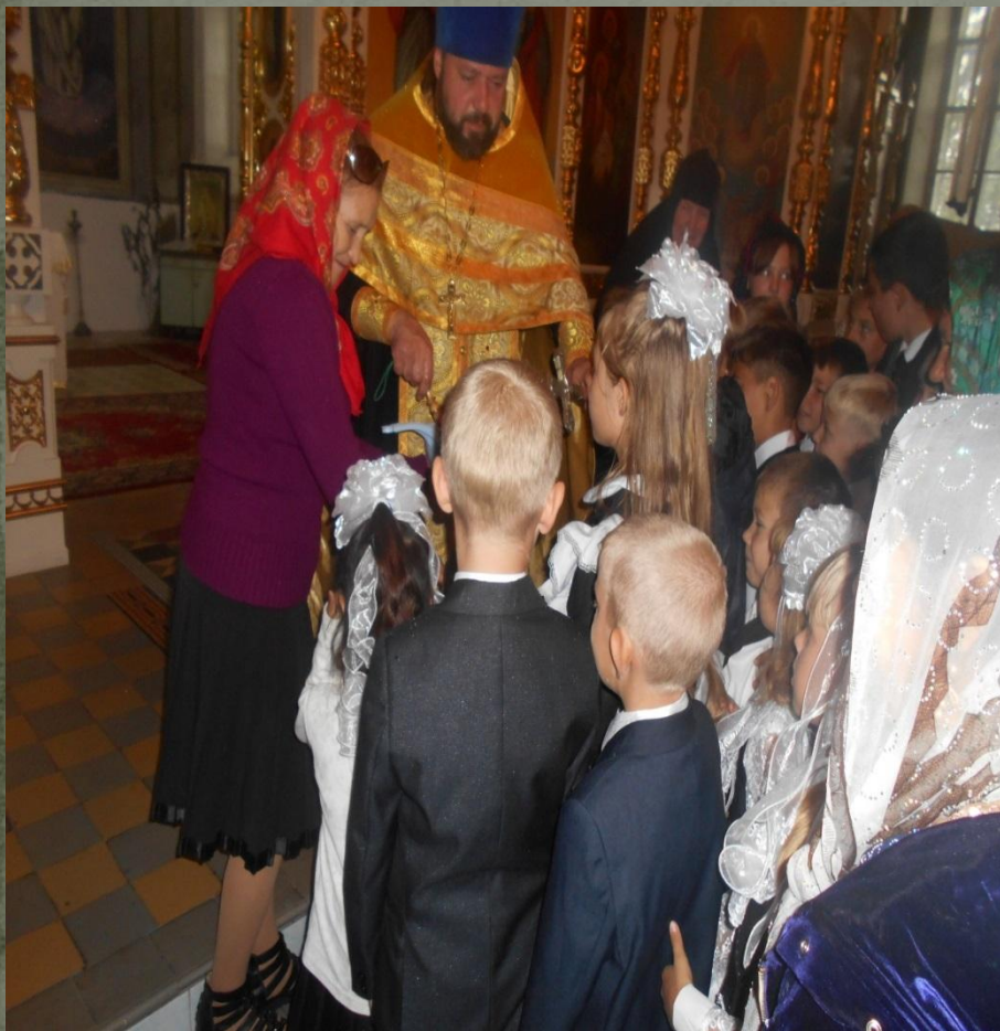
Благословление перед началом учебного года