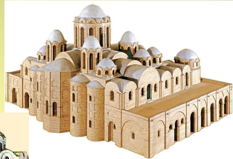
Храм святой Софии.