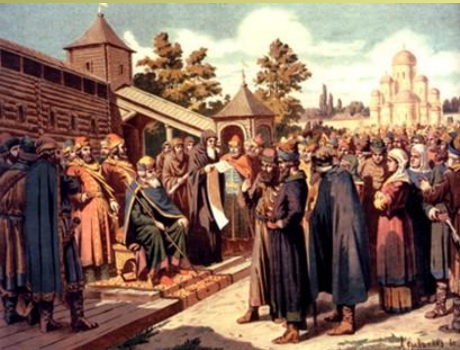
«Чтение народу Русской Правды в присутствии великого князя Ярослава»