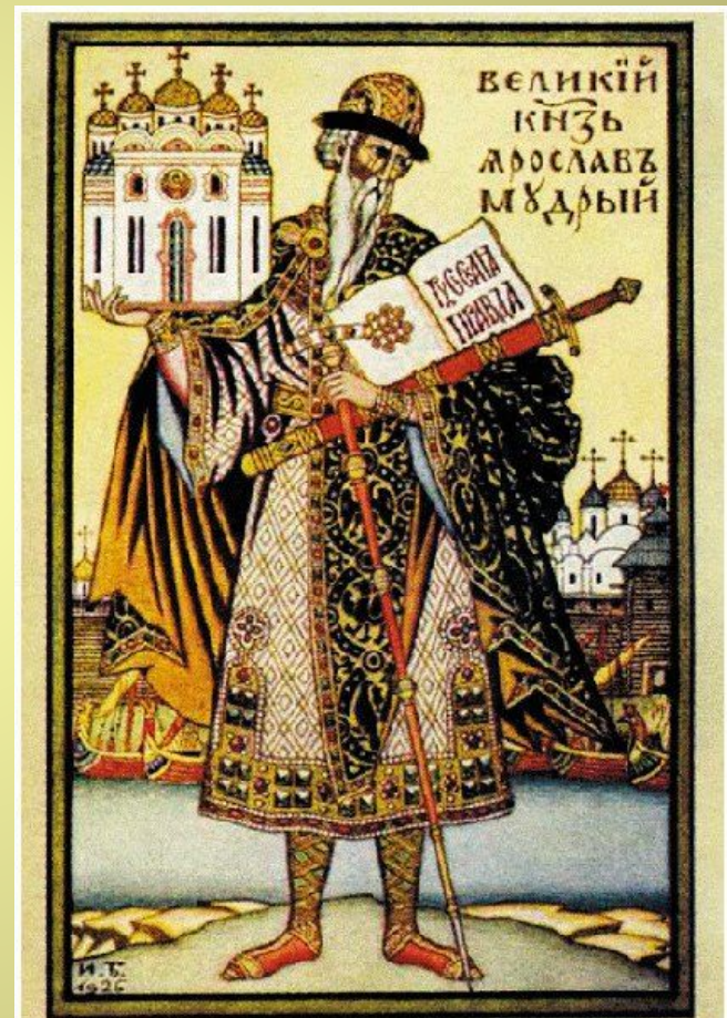
И. Я. Билибин. «Великий князь Ярослав Мудрый», 1926 г.

В течение нашего урока подумайте, оправдывает ли князь Ярослав, прозвище Мудрый?