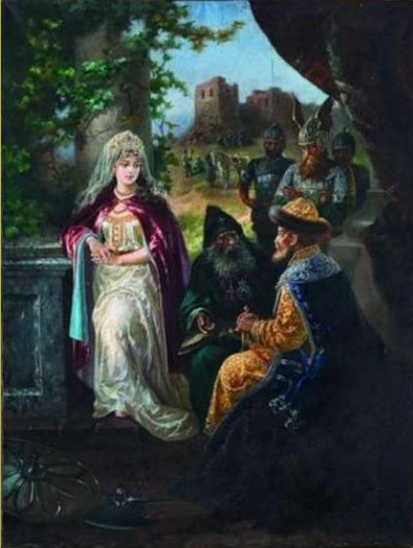
Ярослав Мудрый и шведская принцесса Ингигерде