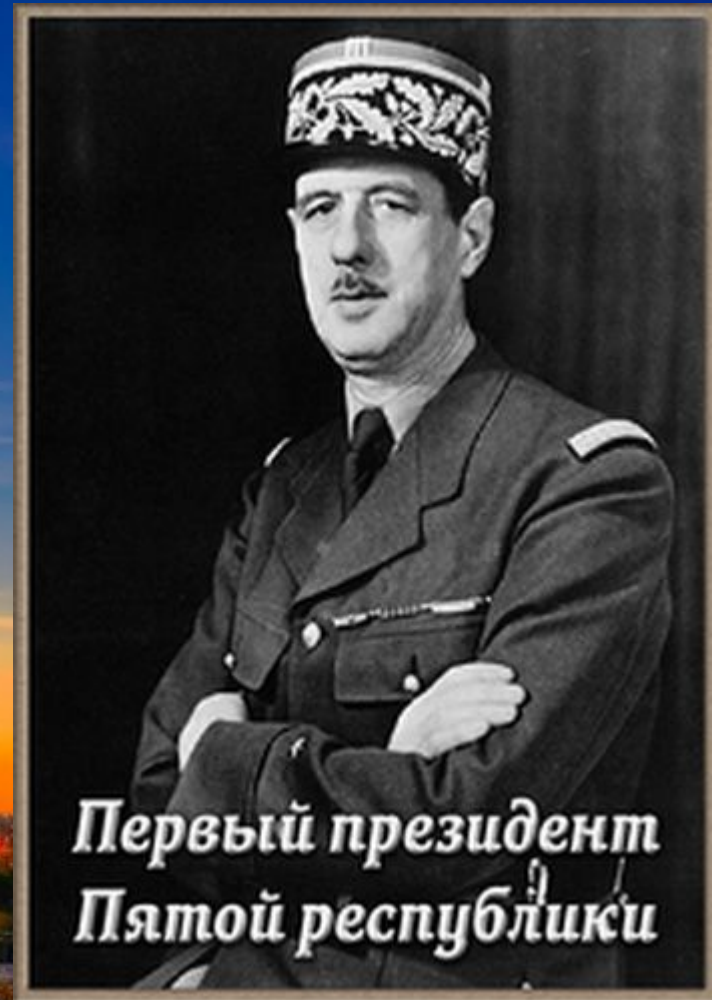
Первый президент Пятой республики

«Большие проекты» – «Конкорд», «Аэробус», ракета «Ариан», скоростные поезда, современная космическая, ядерная и электронно-вычислительная техника.