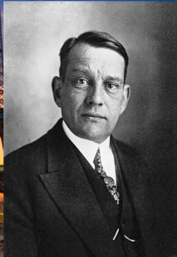
Жюль Гюстав Рене Коти (1954-1959 гг.)

европеисты (сторонник и активной европейской политики)