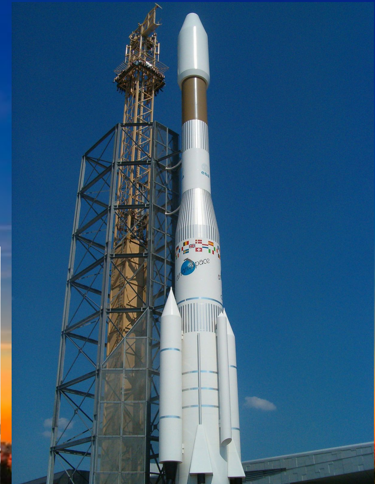
Макет ракеты Ариан 44LP на выставке