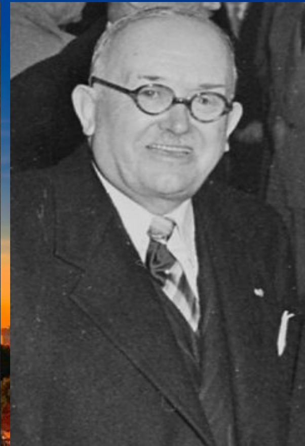
Жюль Венсан Ориоль (1947-1954 гг.)