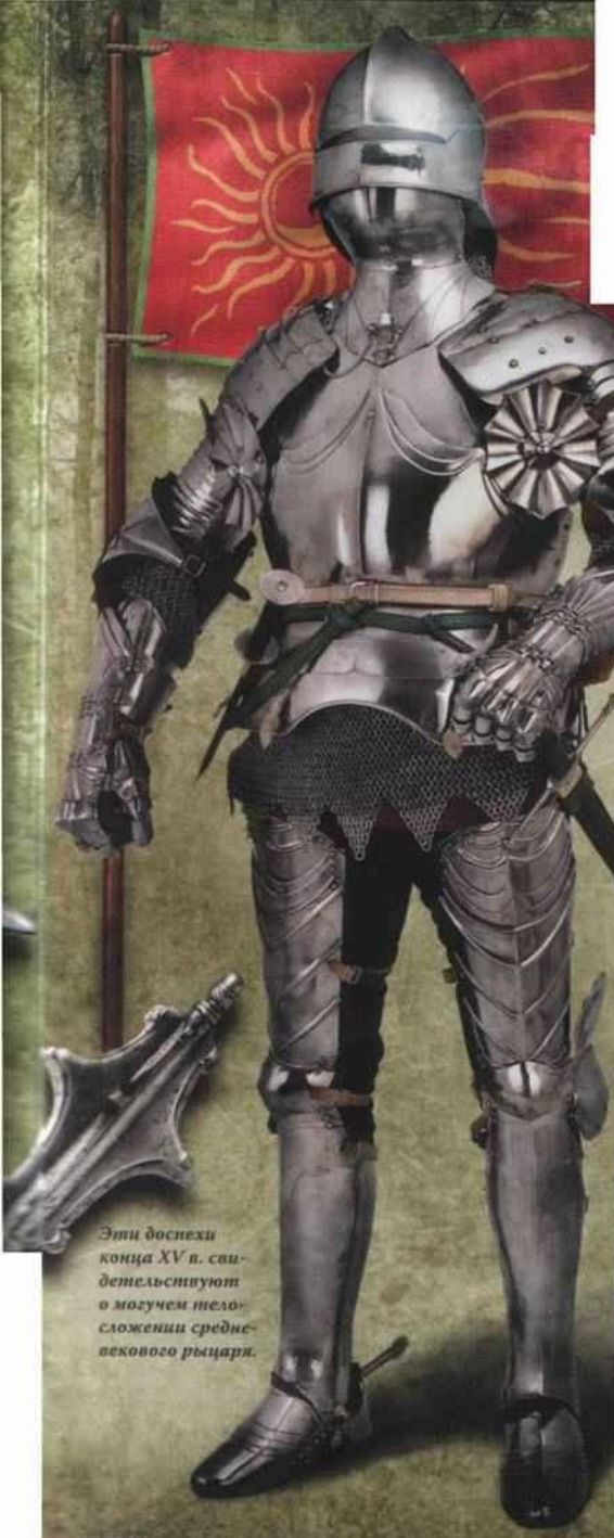
Эти доспехи конца XV в. саи- детельствуют о могучем тело- сложении средне- векового рыцаря.