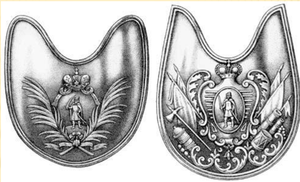
Шейные медальоны офицеров Рязанского пехотного полка