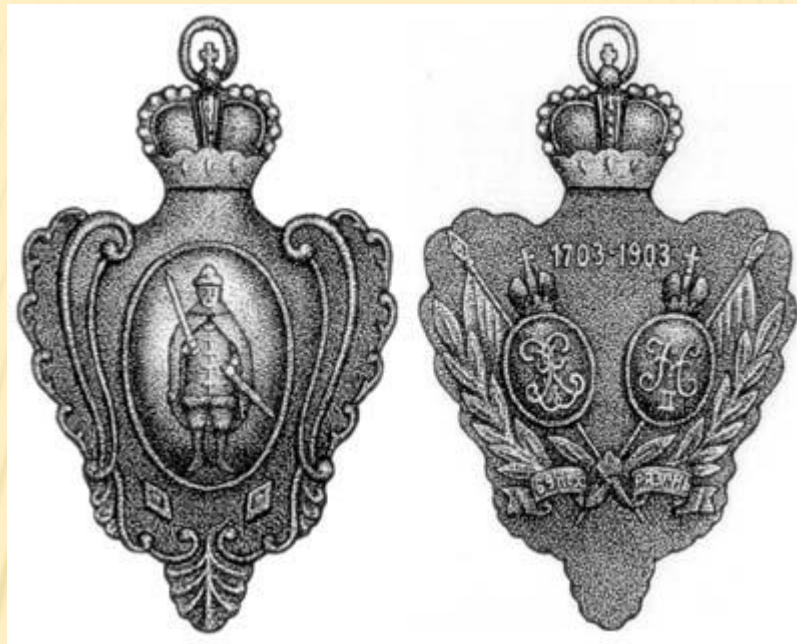
Жетон 69 пехотного рязанского полка, изготовленный к его юбилею