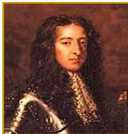
Вильгельм Оранский (1688-1702 г.г.)