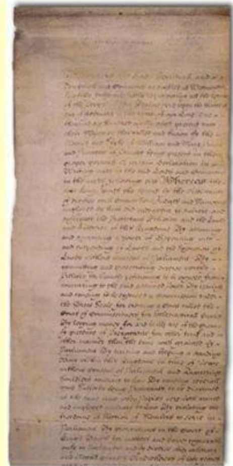
Билль о правах 1689 года.

В Англии установилась конституционная монархия