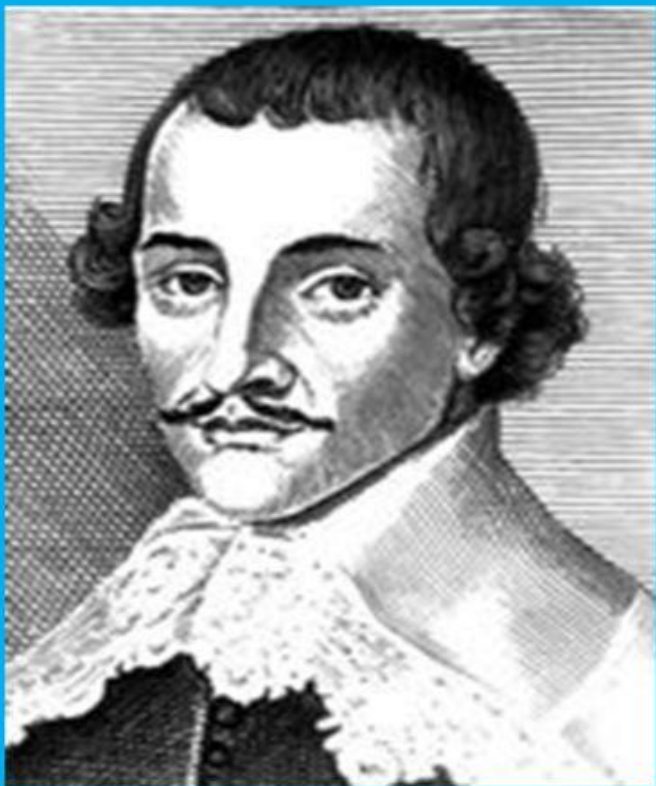
Джон Лильберн – левеллеры