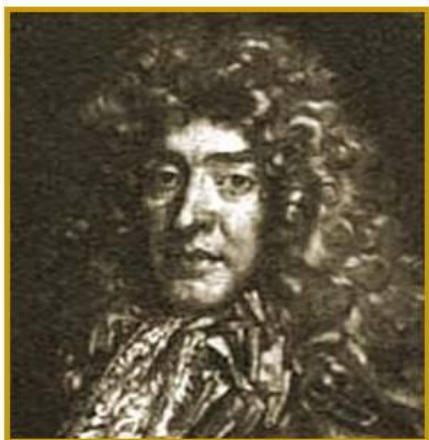
Яков II (1685-1688 г.г.)