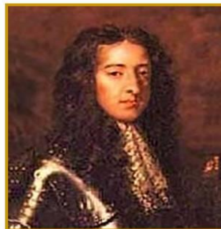
Вильгельм Оранский (1688-1702 г.г.)