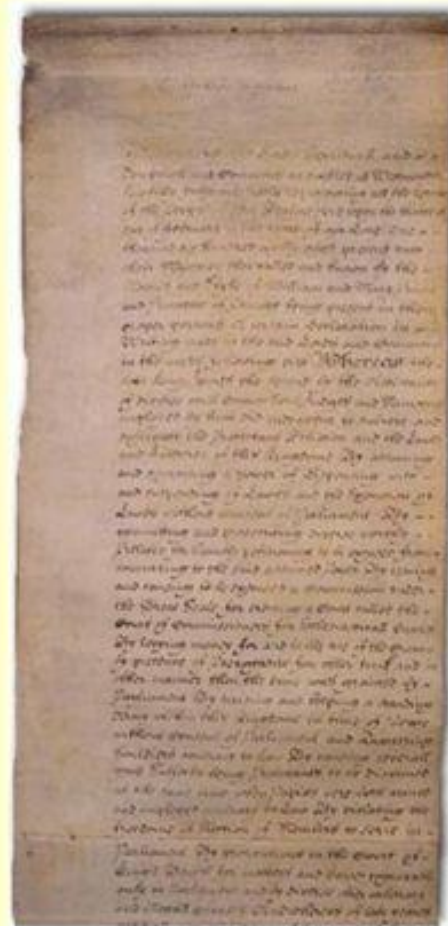
Билль о правах 1689 года.

В Англии установилась конституционная монархия