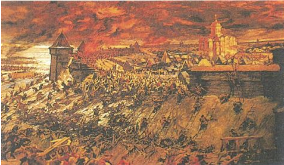
Штурм монголами Рязани. Диорама Е.И. Дешалыта

Задание: Прочитать текст параграфа на стр. 13