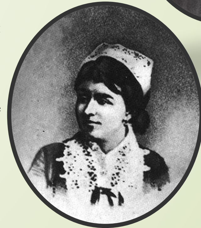
Вторая жена художника