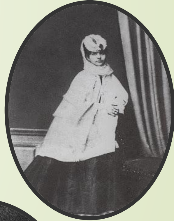
Первая жена художника

Однако было много тяжелого временем в жизни Шишкина. В 1874 году умерла его жена, отчего он замкнулся, его характер — и работоспособность — стали портиться из-за частых запоев. Спасла его, видимо, привычка к труду: из-за своего самолюбия Шишкин не мог позволить себе упустить то место, которое он уже прочно занимал в художественных кругах, и продолжал писать картины, которые становились все популярнее благодаря передвижным выставкам. Именно в этот период были созданы «Первый снег», «Дорога в сосновом лесу», «Сосновый бор», «Рожь» и другие известные картины мастера. А в 1880-х Шишкин женился на красавице Ольге Лагоде, своей ученице. Вторая жена его тоже скончалась, буквально через год после свадьбы — и художник снова ушел с головой в работу, которая позволяла ему забыться. Его привлекала изменчивость состояний природы, он стремился поймать и запечатлеть ускользающую натуру. Он экспериментировал с сочетаниями разных кистей и мазков, оттачивал построение форм, передачу самых нежных цветовых оттенков. Эта кропотливая работа особенно заметна в работах конца 1880-х, например в пейзажах «Сосны, освещенные солнцем», «Дубы. Вечер», «Утро в сосновом лесу» и «У берегов Финского залива». Современников картины Шишкина поражали тем, как легко и свободно он экспериментировал, добиваясь при этом потрясающей реалистичности.