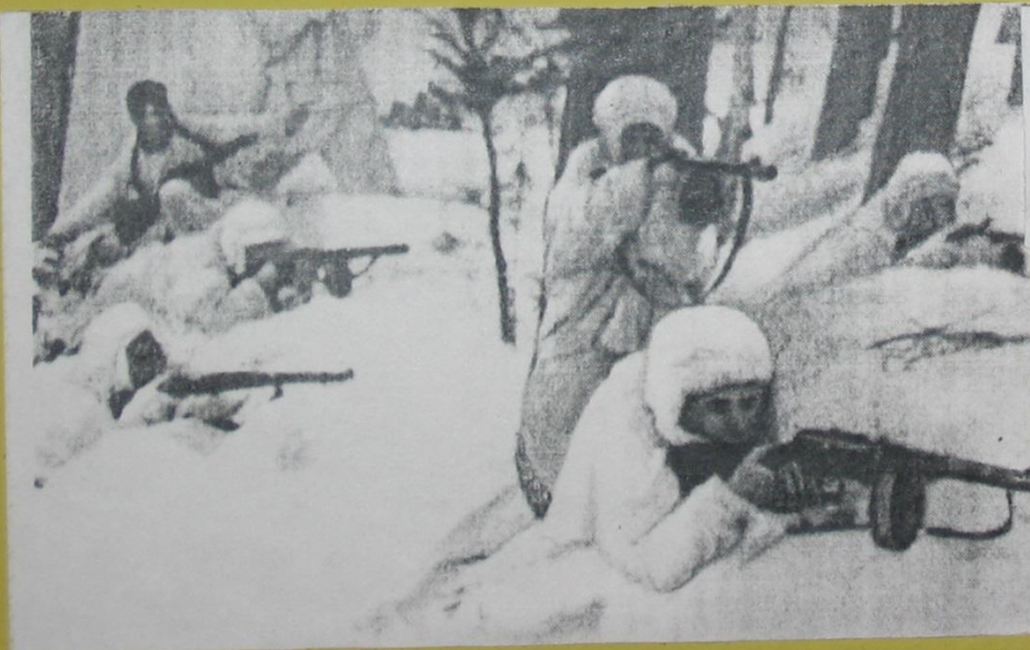
Бойцы истребительного м полка выбивают фашисто пункта деревни Кож