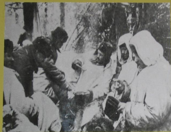
Походный обед декабрь 1941г.

Рузский партизанский отряд размещался в районе