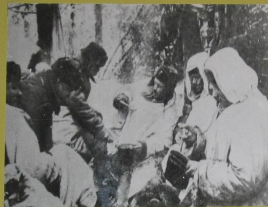
Походный обед декабрь 1941г.

Рузский партизанский отряд размещался в районе