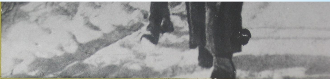
Осташёвский отряд. Конвоируют «языка»