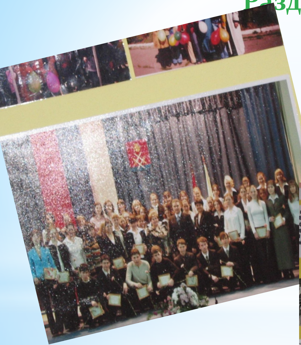
ступени в 1918 году фессора рситата году в

В простом российском городе, Что Рузой называется, Средь серых каменных домов Три школы возвышаются. Волоколамское шоссе, Дом с номером четыре, Это родная наша школа – Одна из лучших в мире!