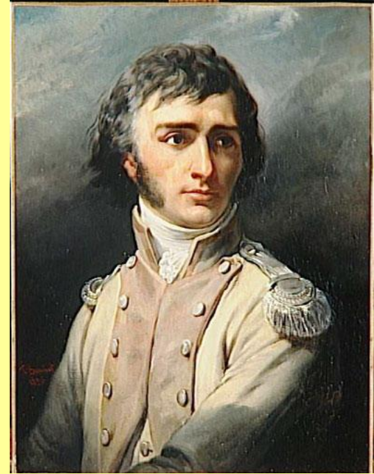
Ф.-Б. Жубер (1769–1799)

Директория объединила армии Моро и Макдональда под командованием генерала Б.К. Жубера.