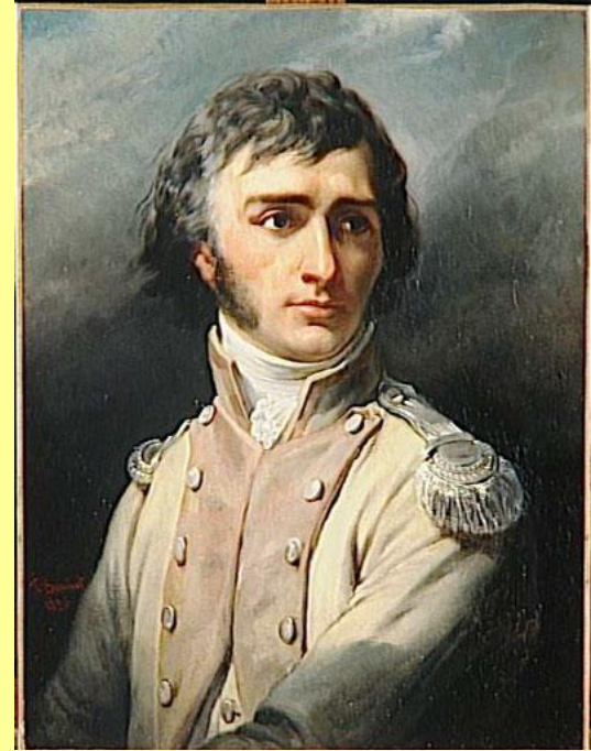
Ф.-Б. Жубер (1769–1799)

Директория объединила армии Моро и Макдональда под командованием генерала Б.К. Жубера.