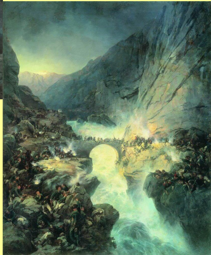
Переход армии Суворова через Чертов мост. Худ. А. Е. Коцебу.