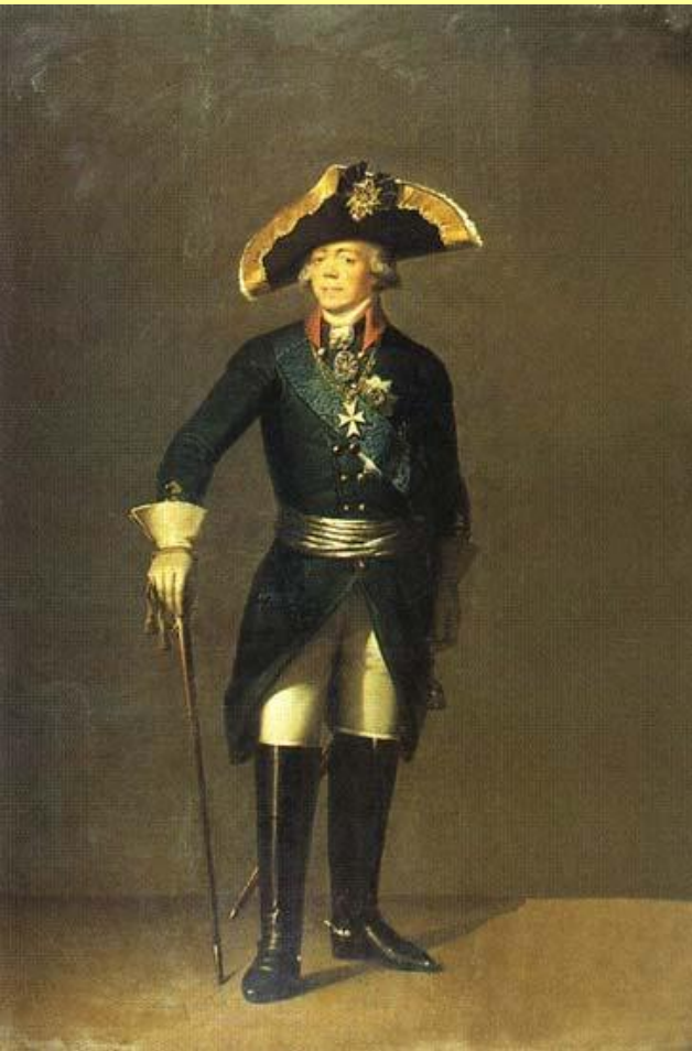
Император Павел I.

В 1800 г. Павел выслал из Петербурга австрийского и английского послов.