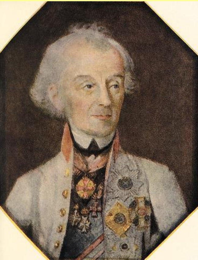
Портрет А.В. Суворова. Худ. И. Шмидт. 1799 г.

В конце 1799 г. Павел отозвал армию Суворова в Россию.