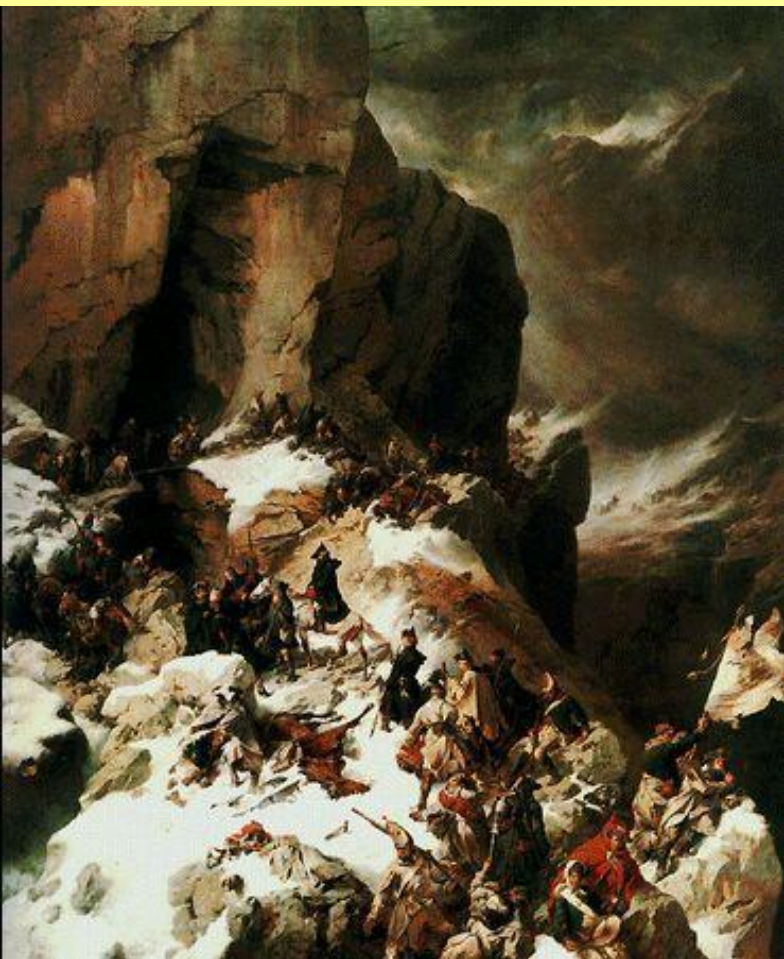
Переход Суворова через перевал Паникс в Альпах. Худ. А.Е. Коцебу.

К моменту прибытия Суворова корпус Римского-Корсакова был разгромлен французскими войсками генерала А. Массена.