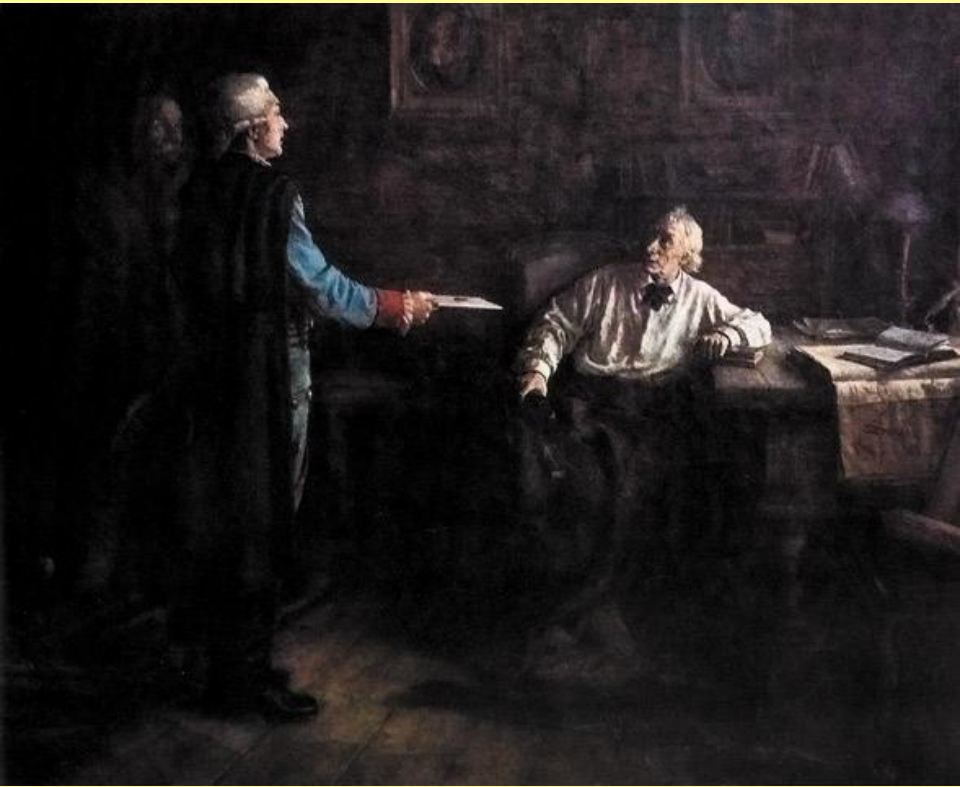
Суворов в селе Кончанском. Худ. С.П. Викторов.

Январь 1799 г. – обращение австрийского правительства к Павлу с просьбой направить в Сев. Италию русские войска и поставить во главе их А.В. Суворова.