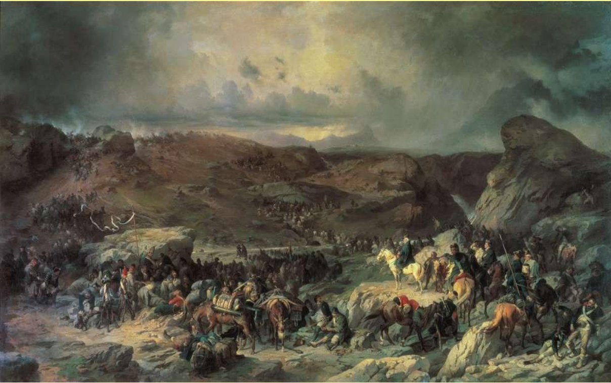
Переход армии Суворова через Сен-Готард 13 сентября 1799 г. Худ. А.Е. Коцебу.

20-тысячная армия Суворова в тяжелых условиях совершила переход через Альпы.