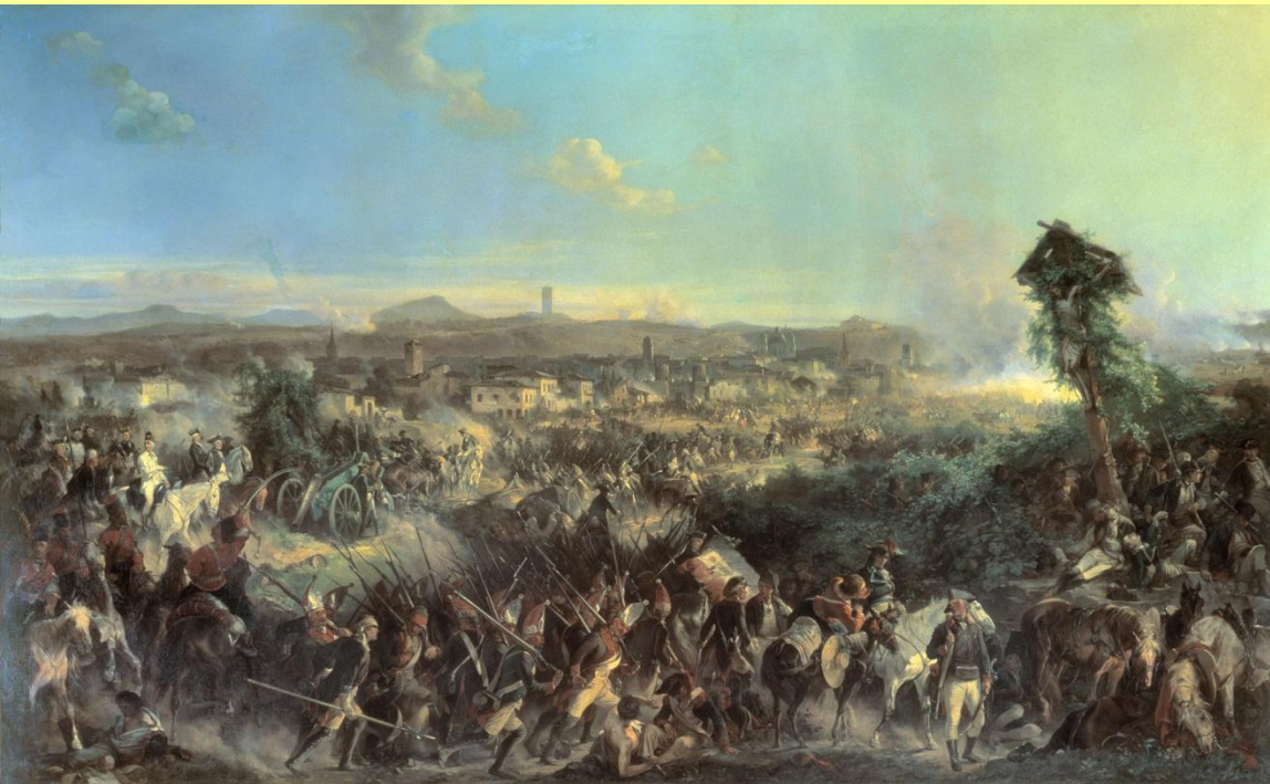
Битва при Нови. Худ. А. Коцебу.

15 августа Суворов разгромил французов при Нови.