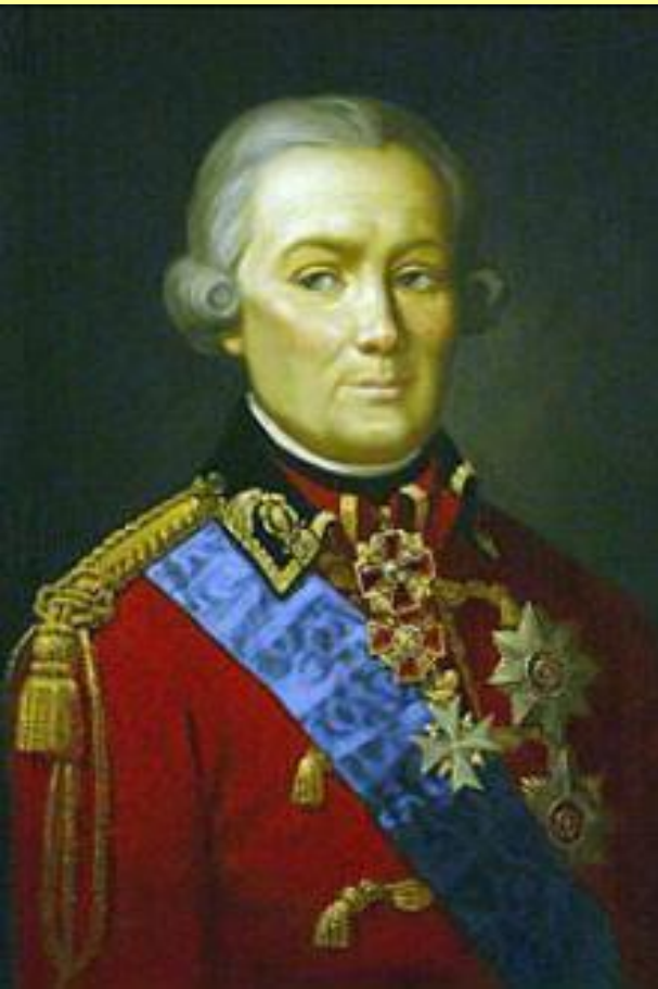
Граф П.А. Пален.

Недовольство внешней политикой Павла лишь усилило раздражение дворянства, и без того считавшего царя самодуром, если не душевнобольным.