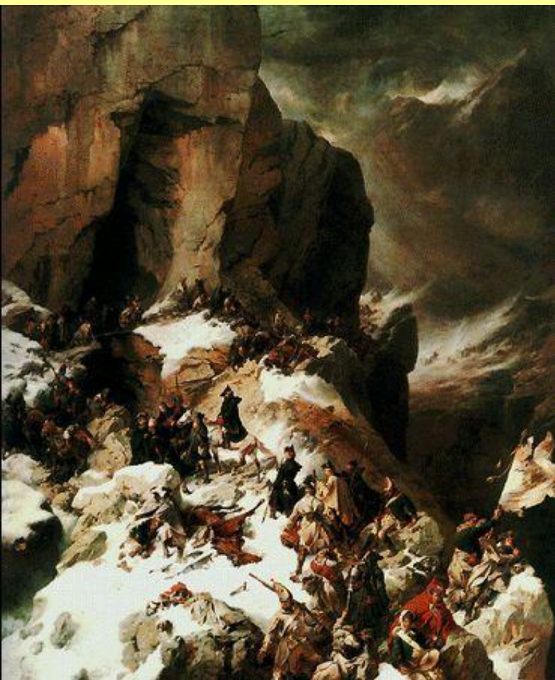
Переход Суворова через перевал Паникс в Альпах. Худ. А.Е. Коцебу.

К моменту прибытия Суворова корпус Римского-Корсакова был разгромлен французскими войсками генерала А. Массена.