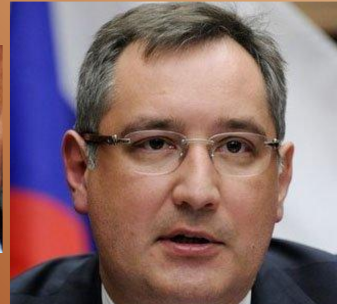
Д. Rogozin, представитель России в НАТО