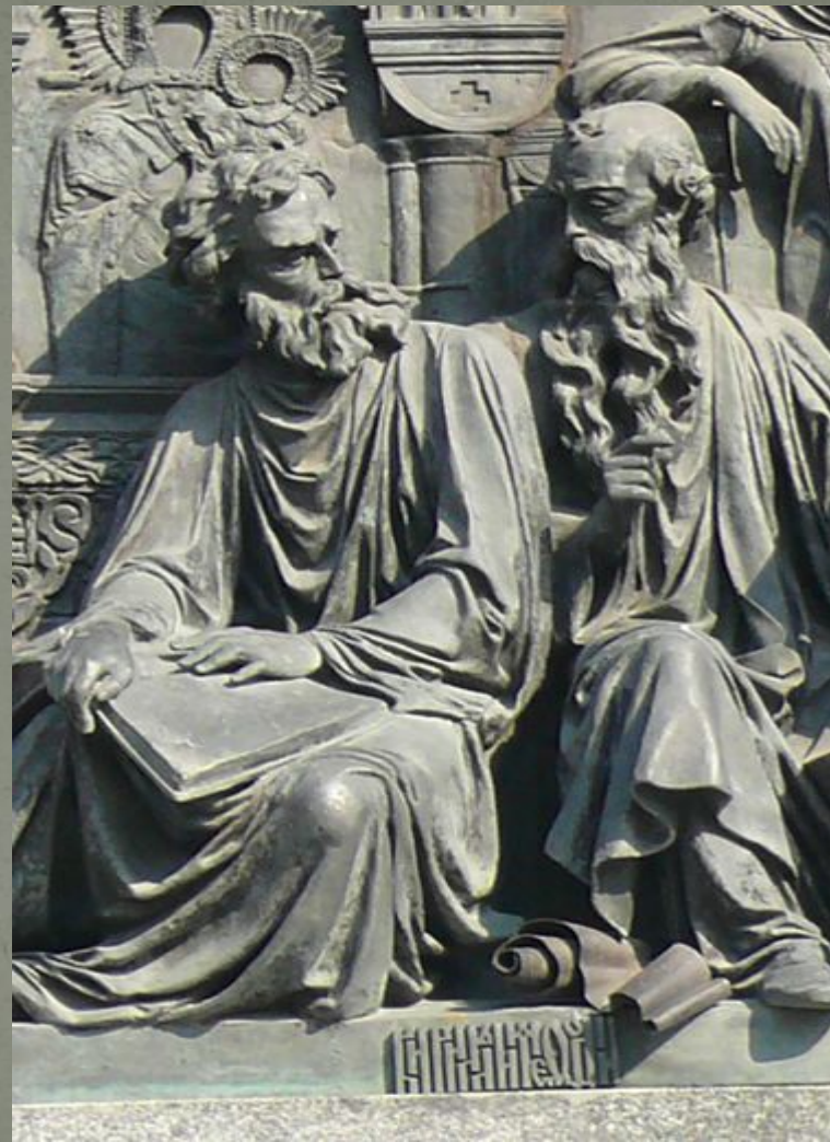
Кирилл и Мефодий.