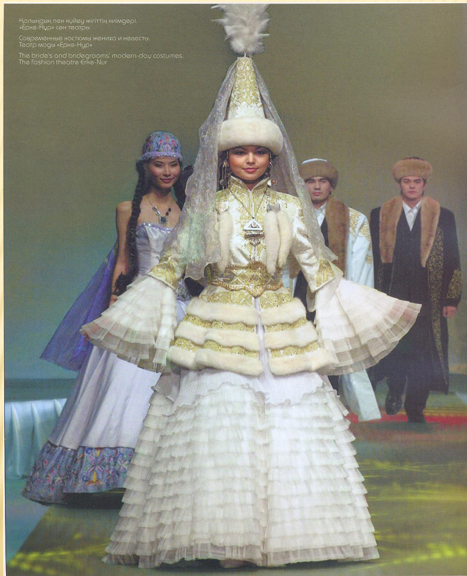
Қазандық пен күйеу жігіттің киімдері, «Ерке-Нур» сән театры Современные костюмы жениха и невесты, Театр моды «Ерке-Нур» The bride's and bridegrooms' modern-day costumes, The fashion theatre Erke-Nur