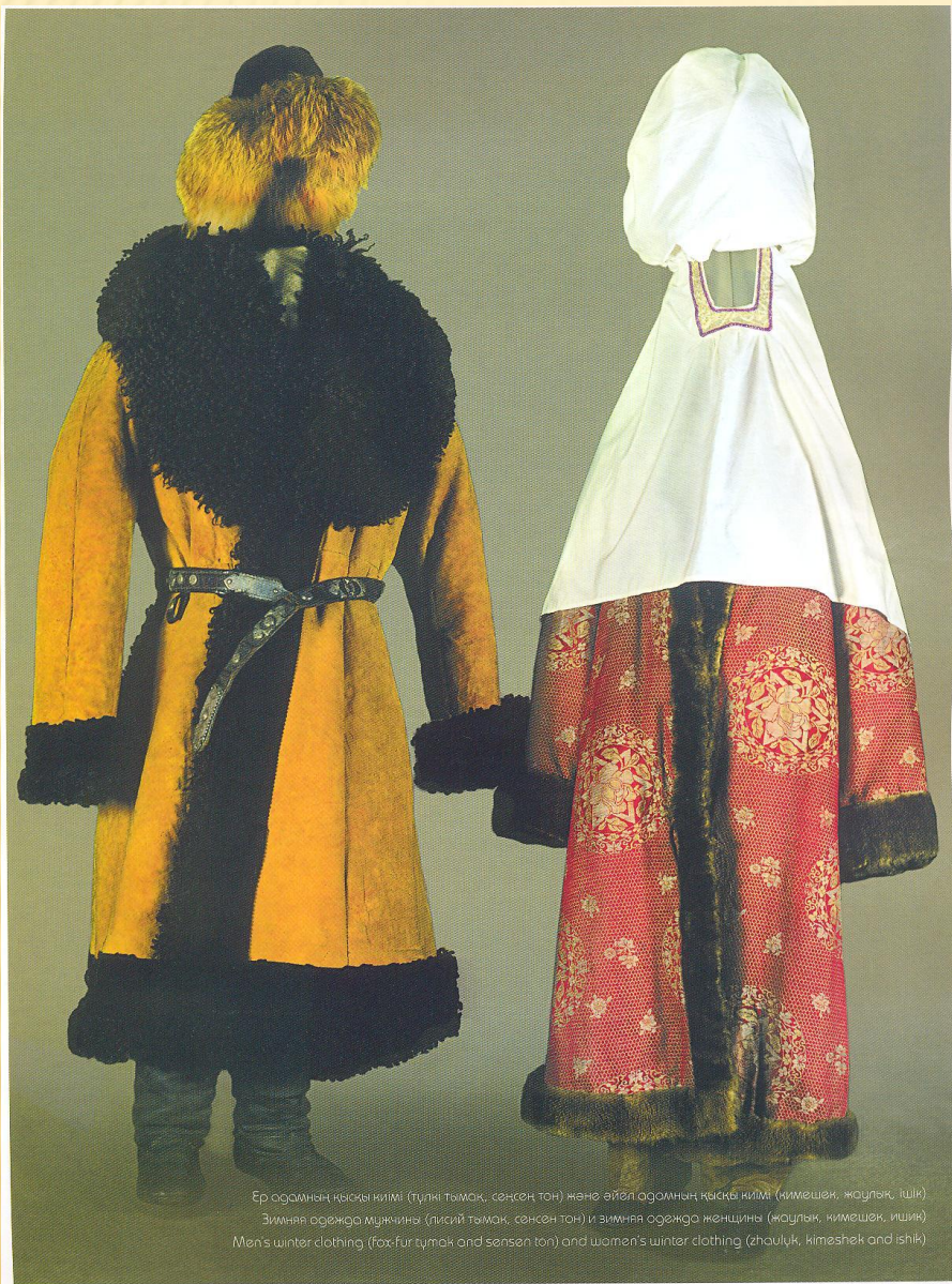
Ер адамның қысқы киімі (түлкі тымақ, сөнсен тоң) және әйел адамның қысқы киімі (кимешек, жаулық, ішік) Зимняя одежда мужчины (лисий тымак, сөнсен тоң) и зимняя одежда женщины (жаулық, кимешек, ішік) Men's winter clothing (fox-fur tyamak and sensen ton) and women's winter clothing (zhauulyk, kimeshek and ishik)

Ер адамның қысқы киімі (түлкі тымақ, тоң) және әйел адамның қысқы киімі (кимешек, жаулық, ішік)