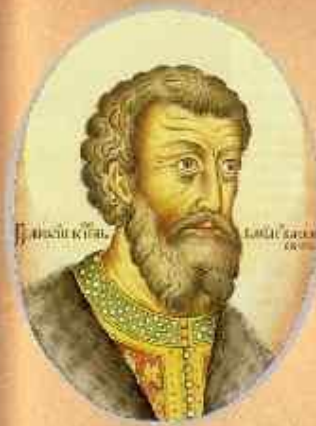
в.кн. князь Василий II Тёмный

1456 г. Василий II совершает поход на Новгород