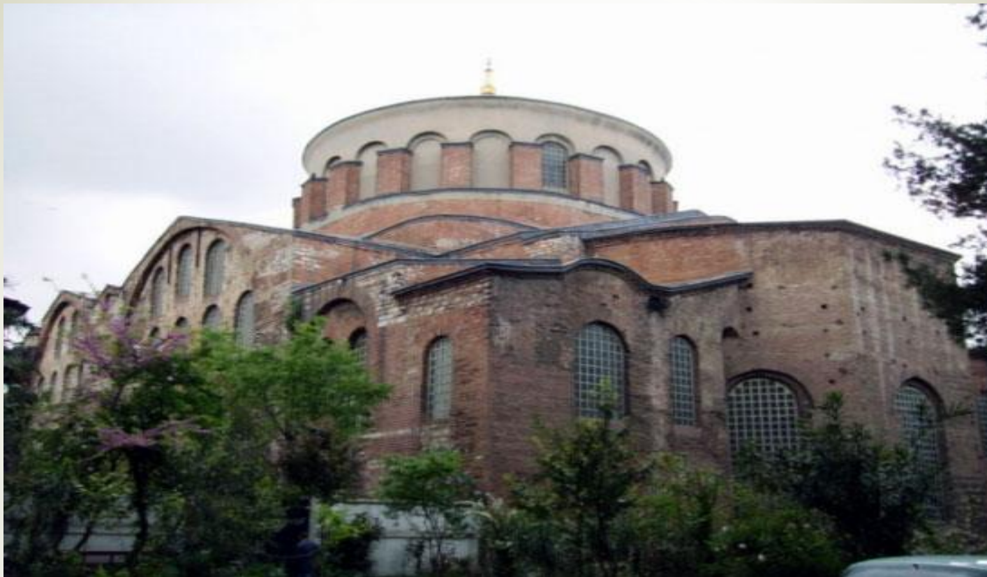
* Церковь святой Ирины