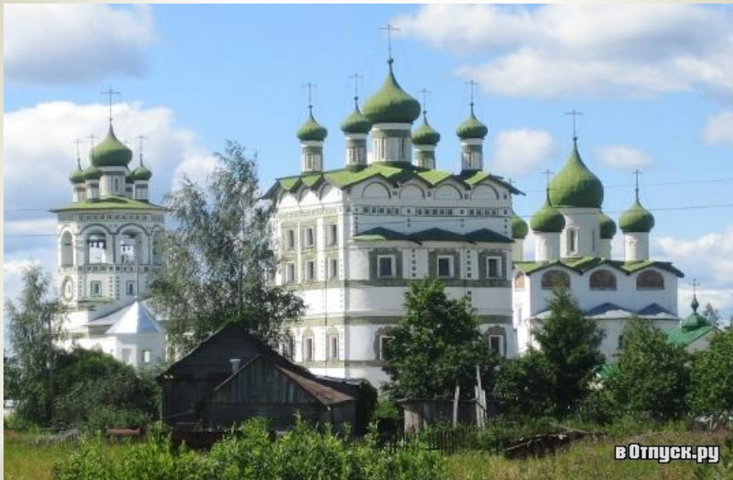
* Николо-Вятитский монастырь