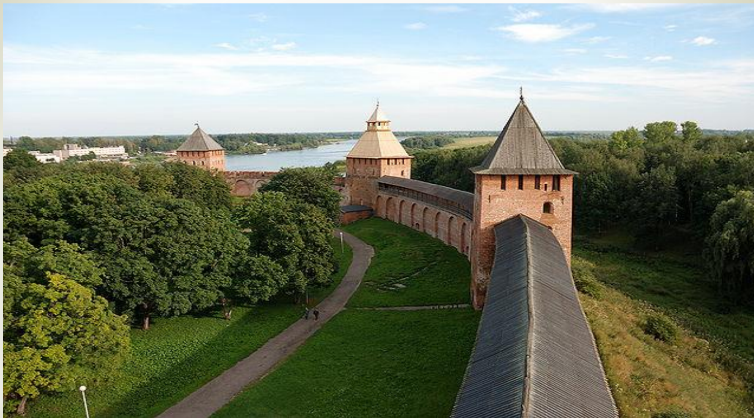
* Новгородский Кремль-детинец