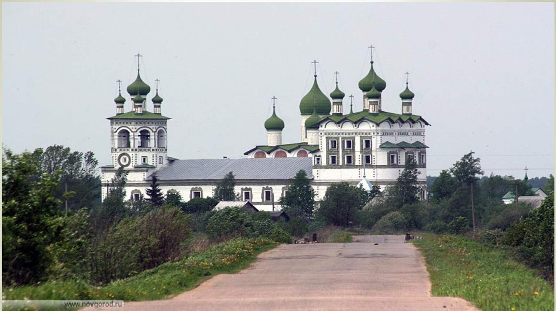
* Николо-Вяжицкий монастырь