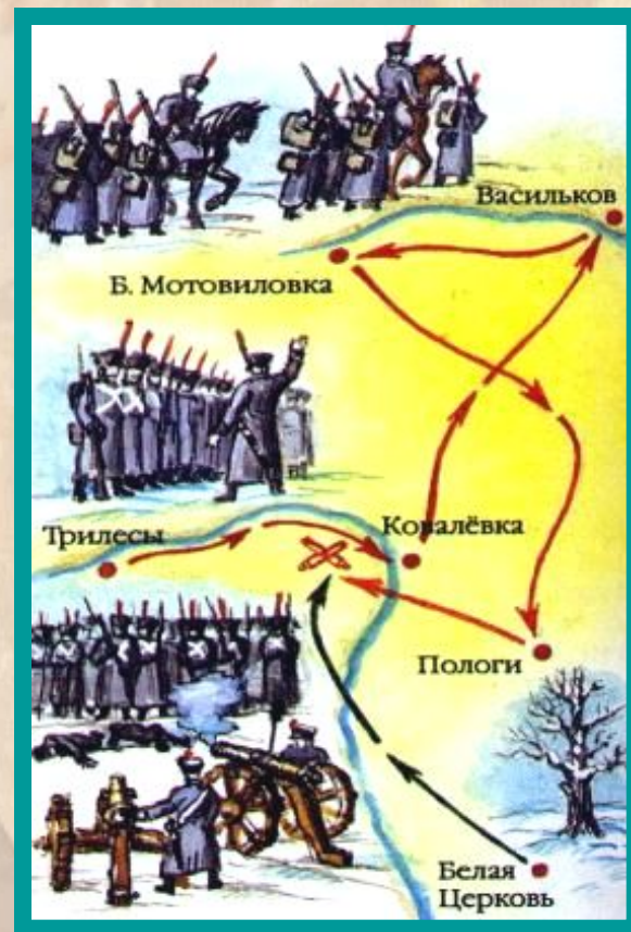
Восстание Черниговского полка.