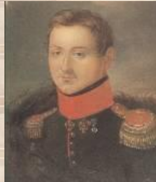
Сергей Муравьев- Апостол