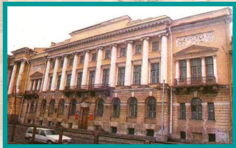
Дом в котором прошло последнее собрание декабристов