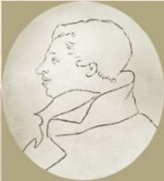
Михаил Бестужев- Рюмин