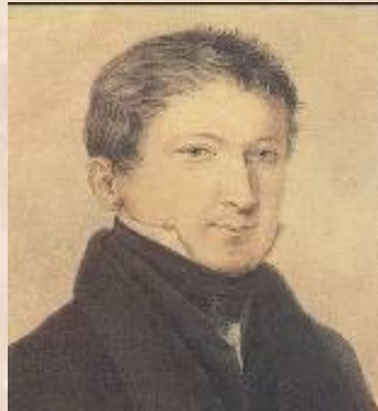
Матвей Муравьев- Апостол