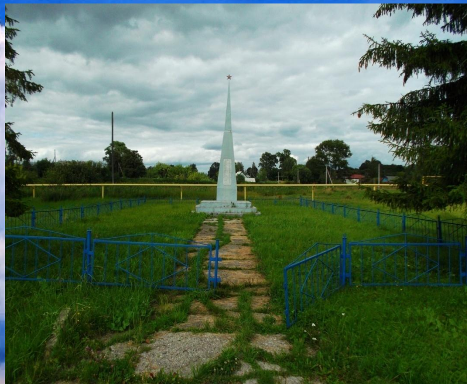
Памятник павшим войнам