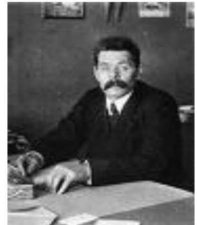
Максим Горький (настоящие фамилия и имя Пешков Алексей Максимович)