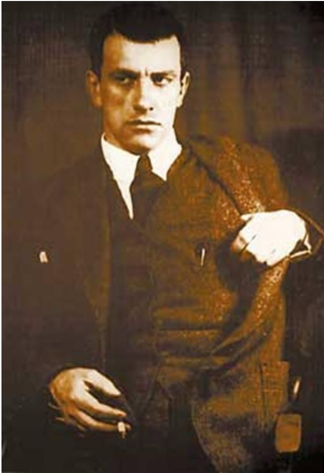
Владимир Владимирович Маяковский