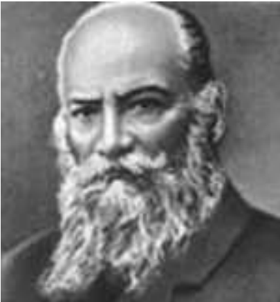
Николай Егорович Жуковский

Большевики стремились привлечь к сотрудничеству ученых, особенно тех, кто способствовал укреплению обороны и экономики страны или имел мировое признание. Им обеспечивались сносные по сравнению с другими слоями населения условия жизни и работы. Многие известные ученые считали своим долгом работать на благо Родины, хотя они не разделяли политических и идеологических воззрений большевиков.