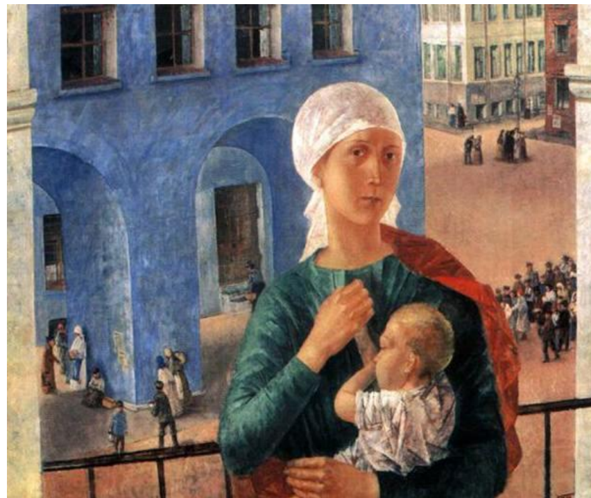
«1918 год в Петрограде» («Петроградская мадонна»), 1920, ГТГ