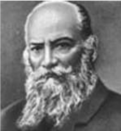
Николай Егорович Жуковский

Большевики стремились привлечь к сотрудничеству ученых, особенно тех, кто способствовал укреплению обороны и экономики страны или имел мировое признание. Им обеспечивались сносные по сравнению с другими слоями населения условия жизни и работы. Многие известные ученые считали своим долгом работать на благо Родины, хотя они не разделяли политических и идеологических воззрений большевиков.