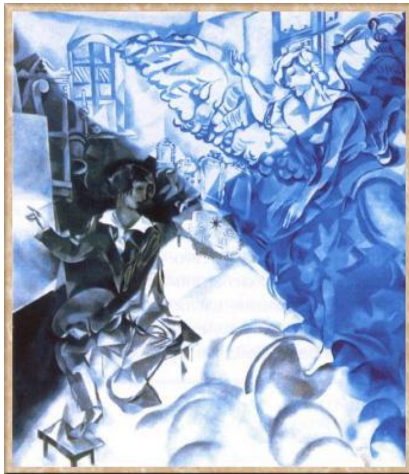
Автопортрет с музой (Видение). 1917-18. Масло