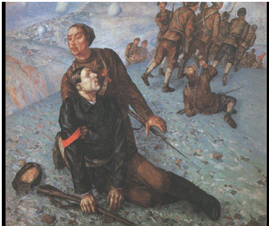
«Смерть комиссара», 1928

Петров-Водкин с первых лет революции был активным участником художественной жизни Советской страны, входил в одно из самых значительных художественных обществ 1920-х годов - "4 искусства". Немало сил он отдал преподавательской деятельности, разработке теории живописи. Он стремился передать молодежи свою захваченность переживанием космической природы жизни, научить "живому смотрению" на мир и повторял как завещание грядущим поколениям: "Мыслите о Земле как о планете, и никогда не ошибетесь, ребята!"