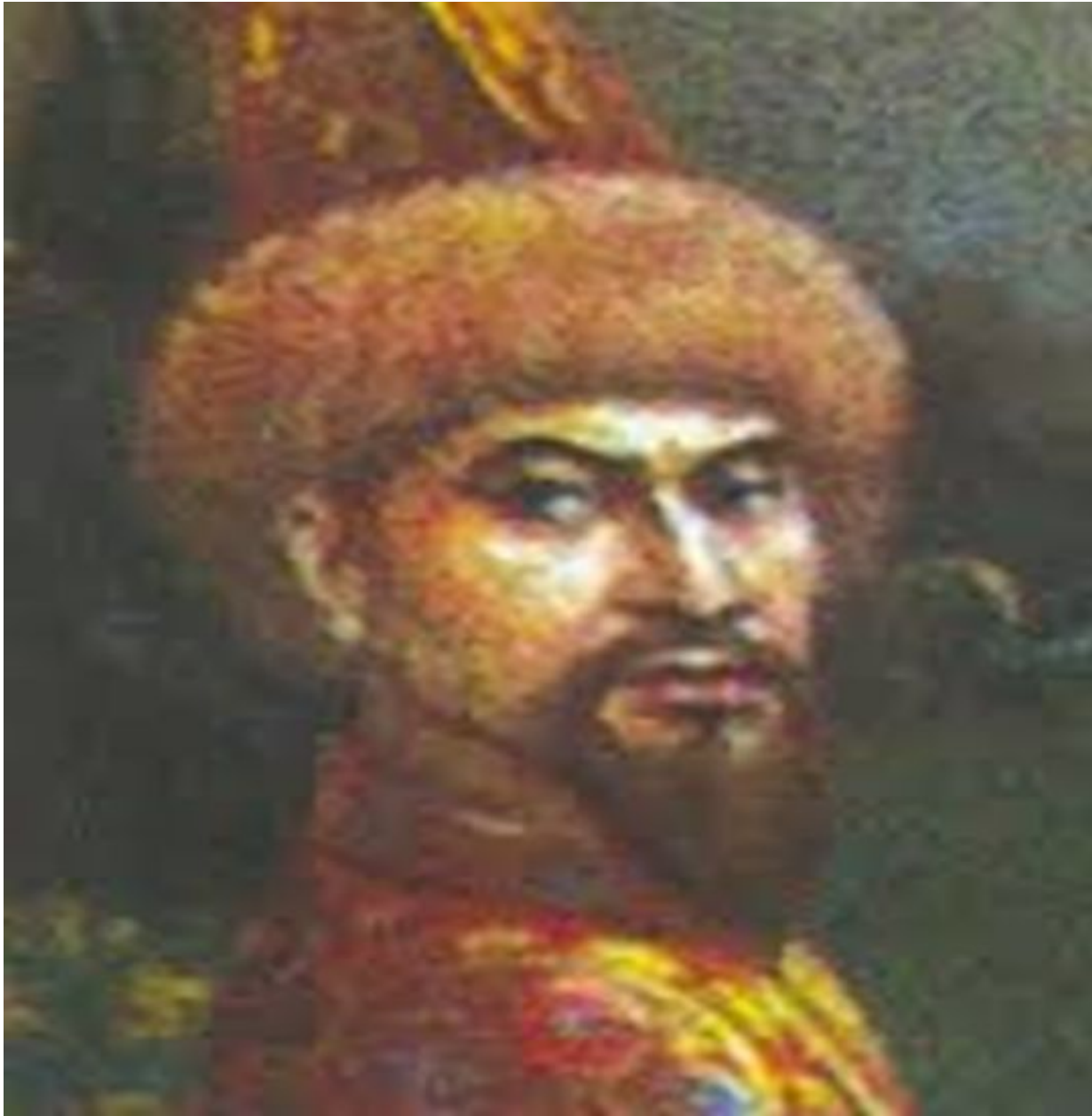
Тауке хан 1680-1715