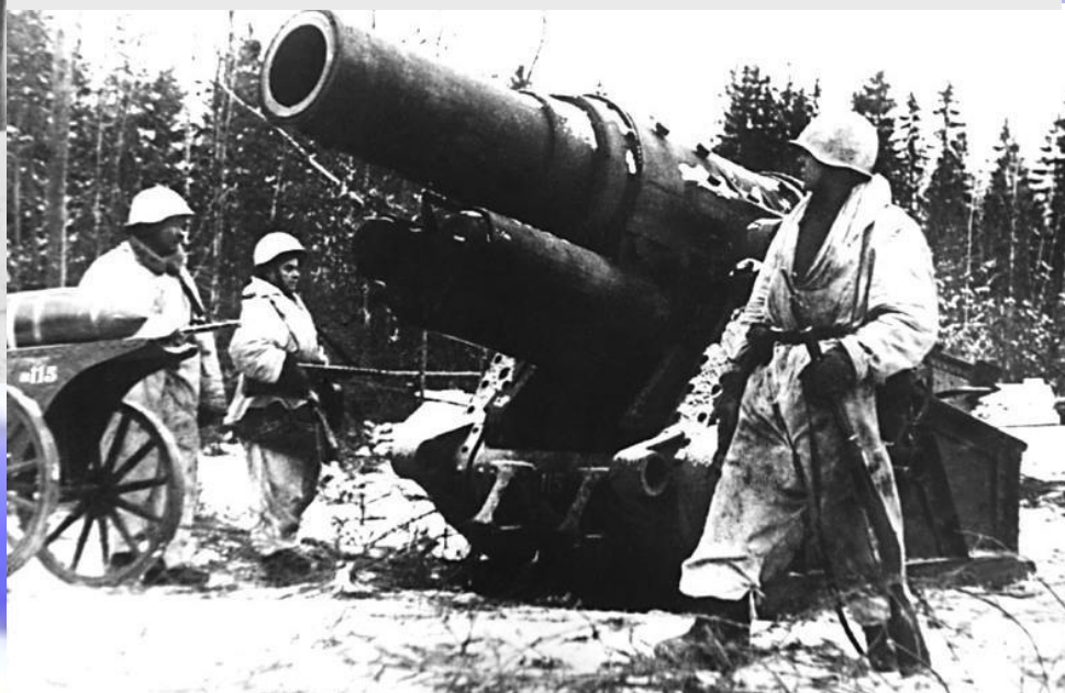
Немецкое тяжелое осадное орудие, обстреливавшее Ленинград