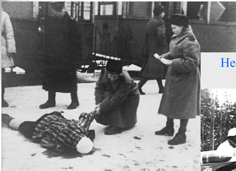
Результаты обстрела. Ленинград, декабрь 1943 г.

После провала немецкого блицкрига В.Лееб был отстранен от командования группой «Север». Его место занял генерал-полковник Г. Кюхлер. Выполняя приказ Гитлера, новый командующий начал вести войну на уничтожение. Немцы обстреливали улицы, сбрасывали бомбы, затапливали продовольственные обозы.