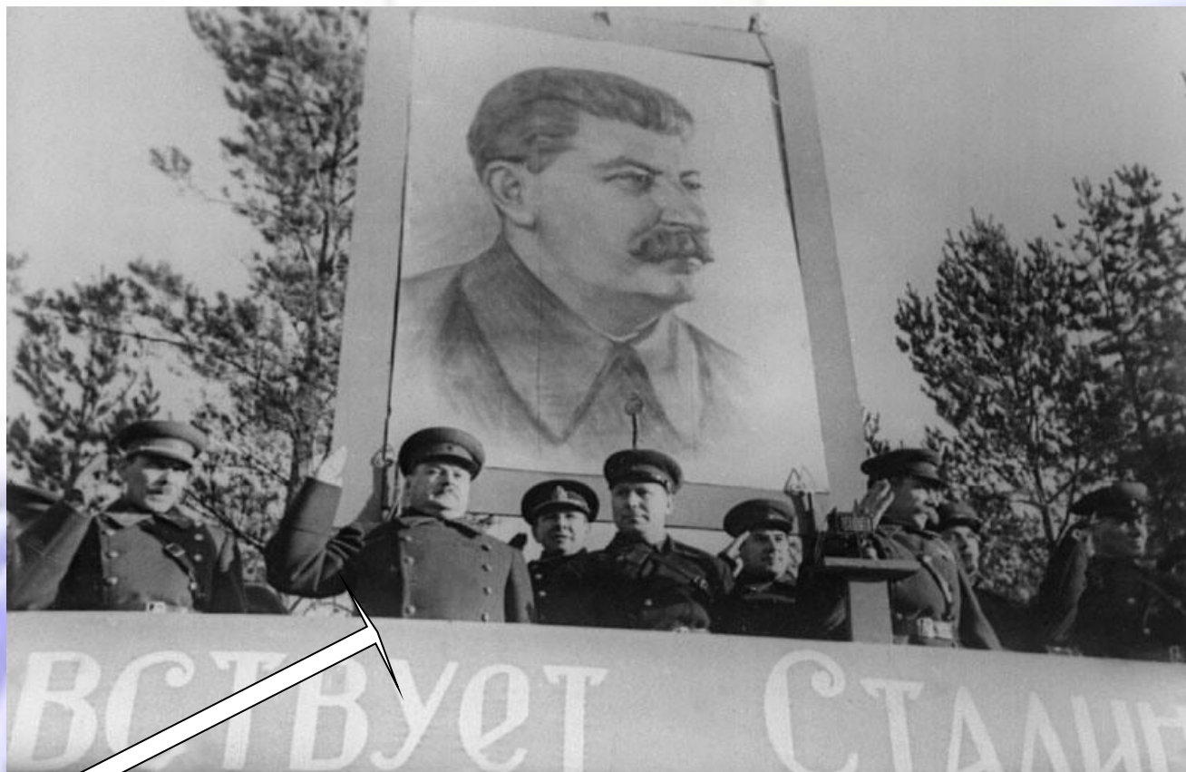
Секретарь Ленинградского обкома партии А.А. Жданов выступает на митинге. Ленинград, 1942 г.

Однако Первый секретарь Ленинградского обкома ВКП (б), член Военного Совета войск Ленинградского фронта, генерал-полковник А. А. Жданов фактически не участвовал в обороне города. Не испытывал он и мук голода; ему даже пришлось заниматься физкультурой, чтобы сбросить лишний вес.