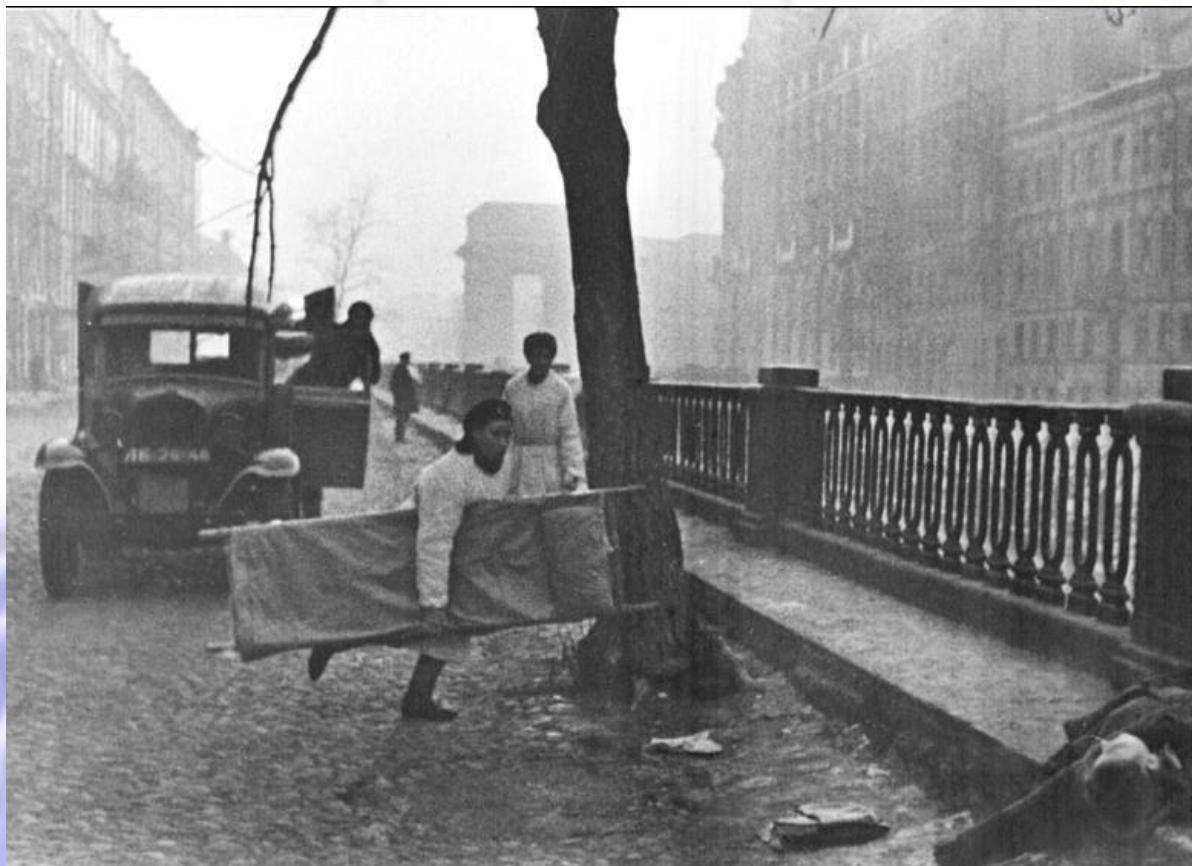
Во время артобстрела Ленинграда

На момент начало блокады в Ленинграде находились 2 миллиона 544 тысячи человек, в том числе около 400 тысяч детей. Эвакуацию осуществить не успели: начались бомбардировки и обстрелы, город оказался в кольце врага.