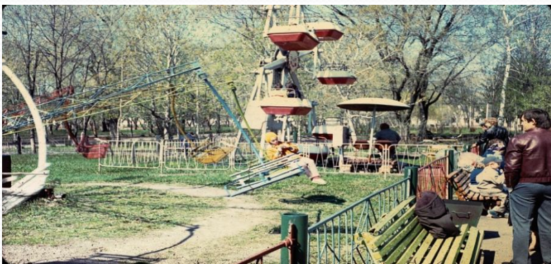
Детская площадка в парке. Фото 90-х годов XX века