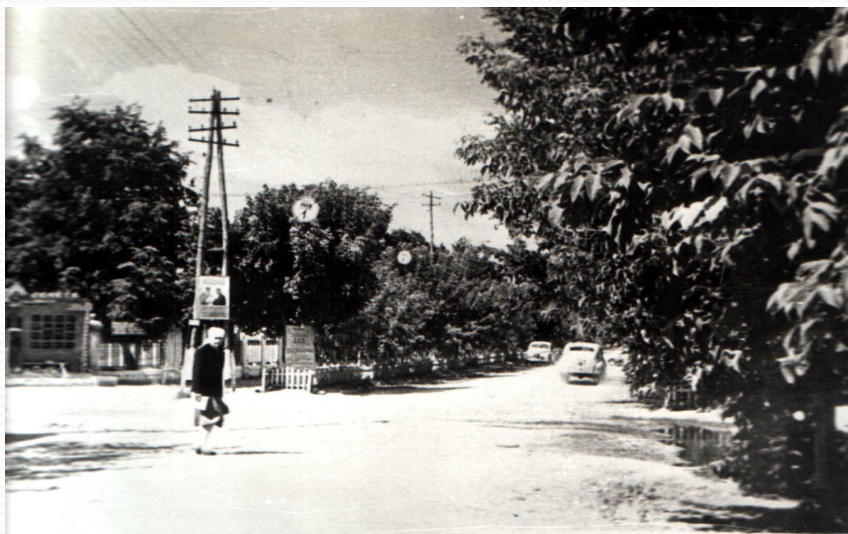
50-е годы районная доска почёта ул. Кирова – III Интернационала