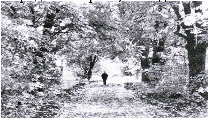
Городской парк в 90-е годы XX века