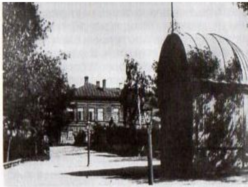
Первый городской парк. Фото XX века