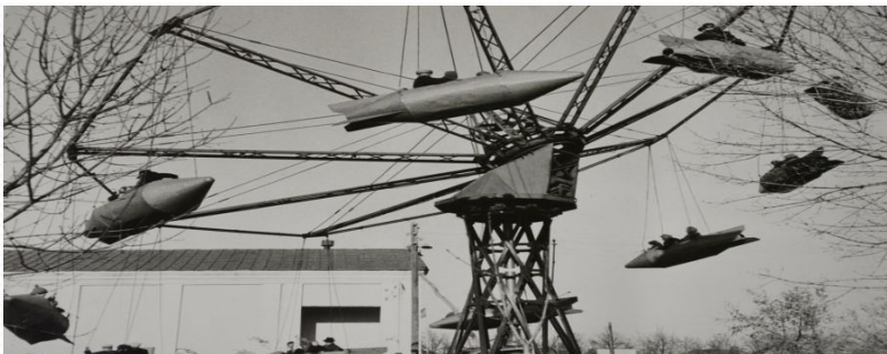
Детская площадка в 80-е годы XX века