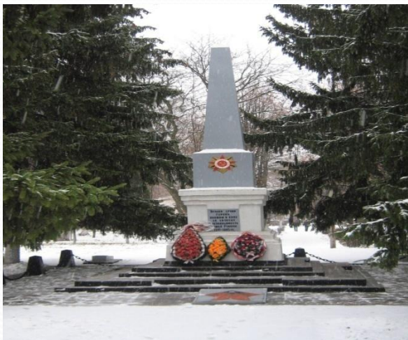
Фото 2009 года