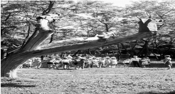
Городской парк в 70-е годы XX века