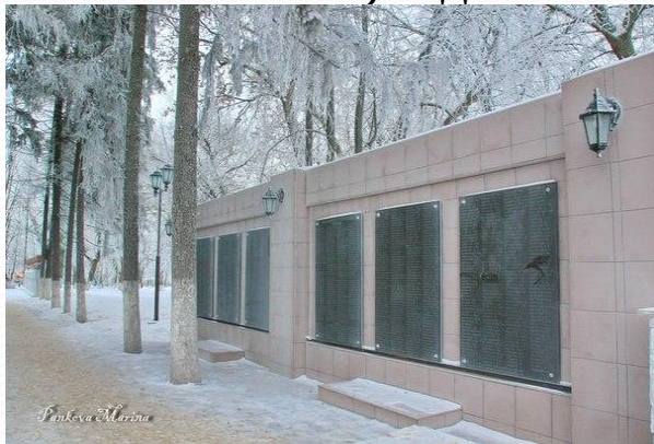
Фото 2014 года