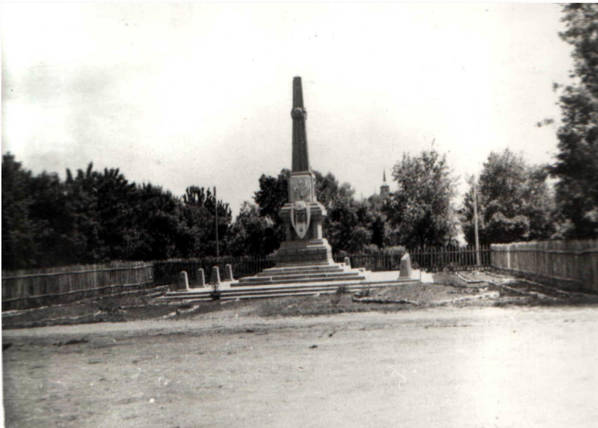
1954 год. Обелиск. Автор и исполнитель проекта Игорь Васильевич Курочкин