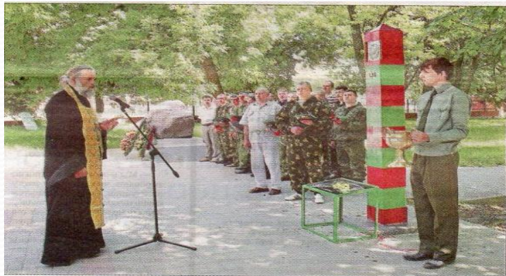
Фото 2014 года