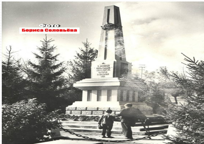
Обелиск в 80-е годы XX века