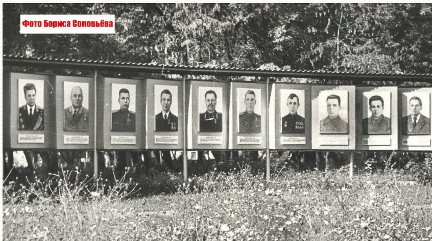
Портреты Героев Советского Союза