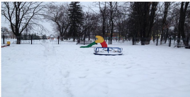
Детская площадка в парке. Фото 2015 года