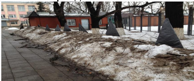
Фото 2015 года