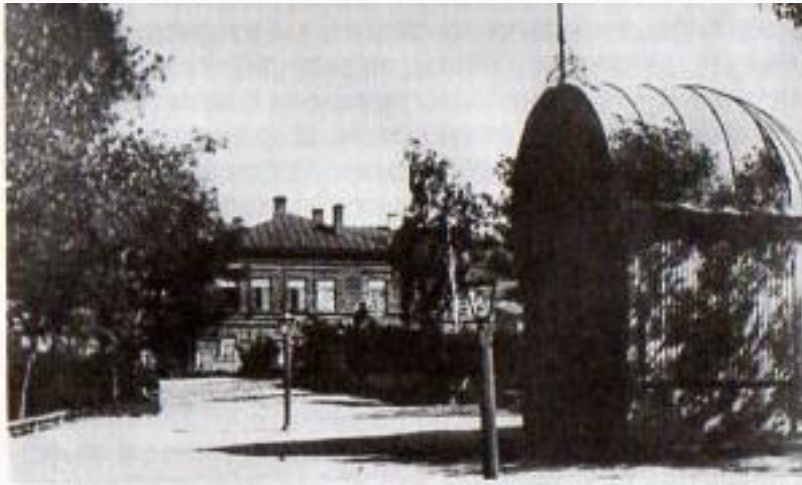
Первый городской парк. Фото XXвека