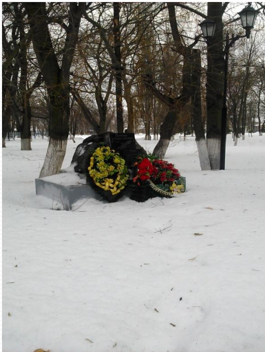
Фото 2015 года