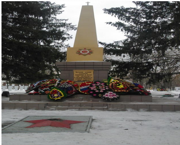
Фото 2015 года