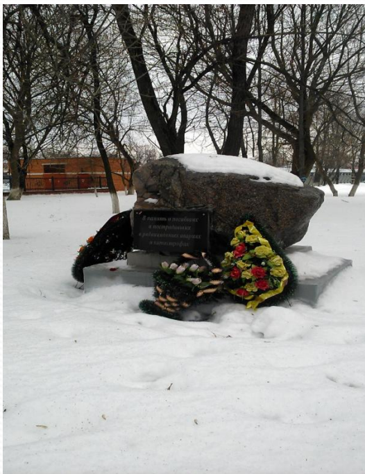
Фото 2015 года