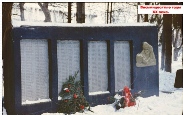
Фото 80-х годов XX века