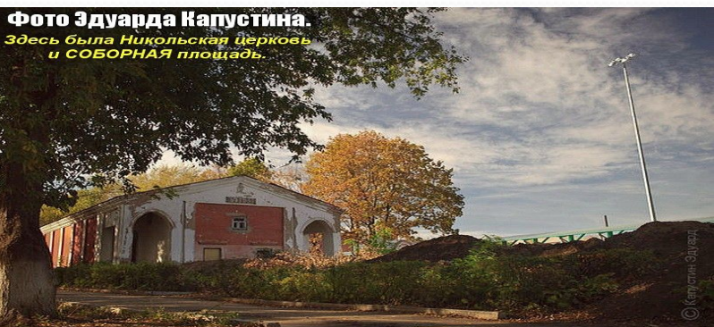
Летний кинотеатр «Мир» в 80-е годы XX века