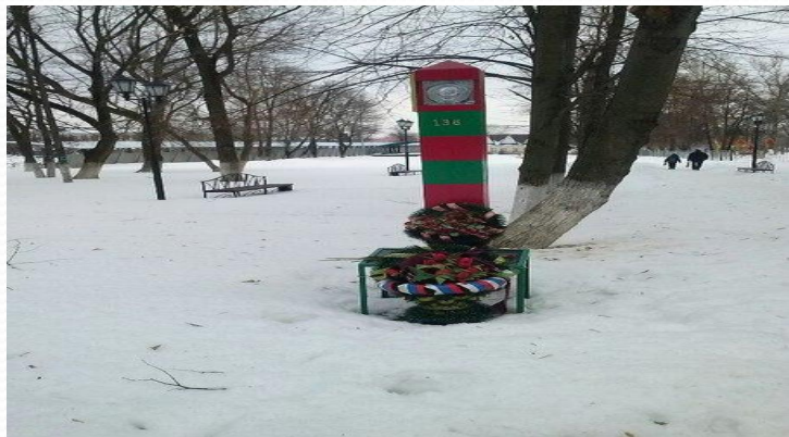
Пограничный столб. Фото 2015 года