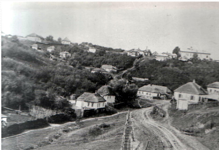
Фото 1949 года