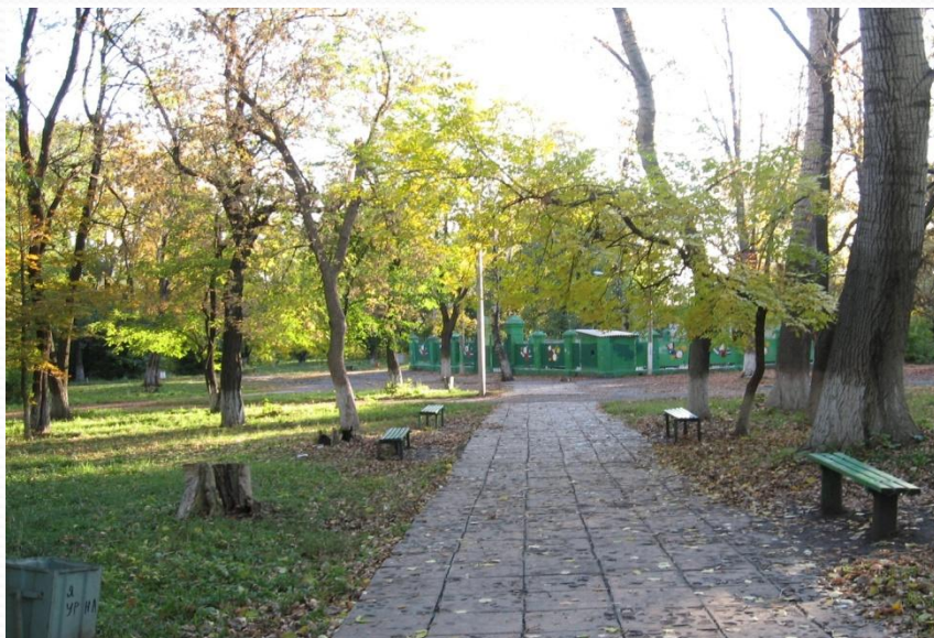
Танцплощадка в парке. Фото 2010 года