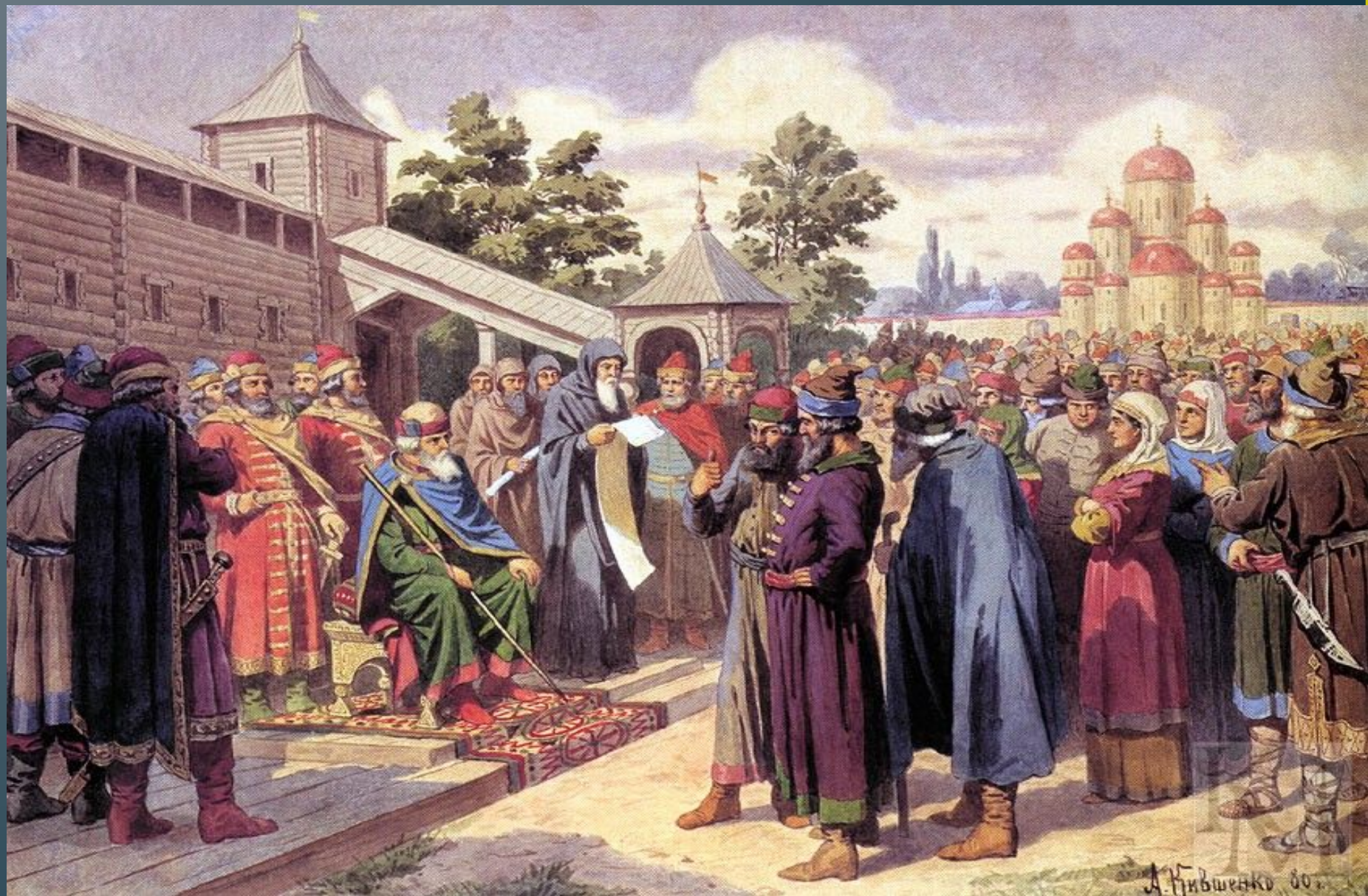
"Чтение народу Русской Правды в присутствии великого князя Ярослава Мудрого."