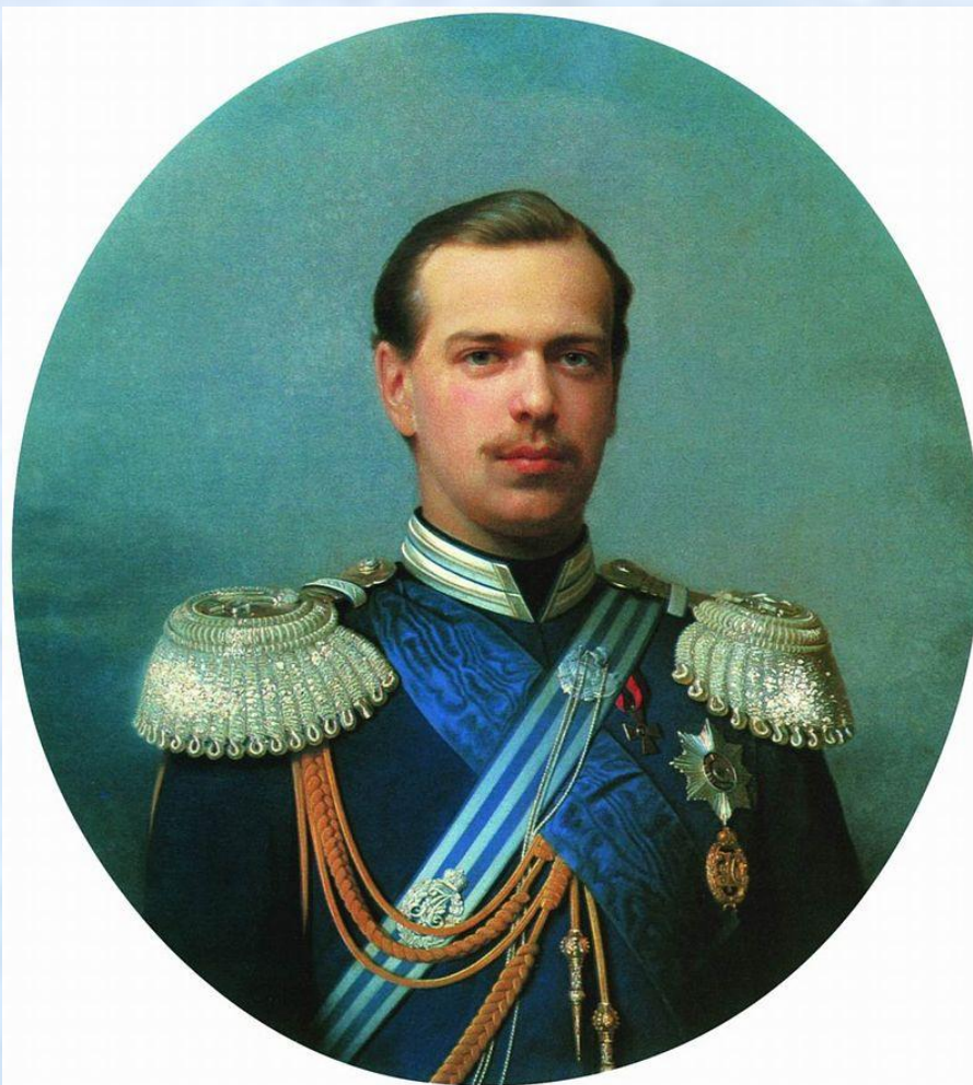
Великий князь Александр Александрович Романов, 1867 г.