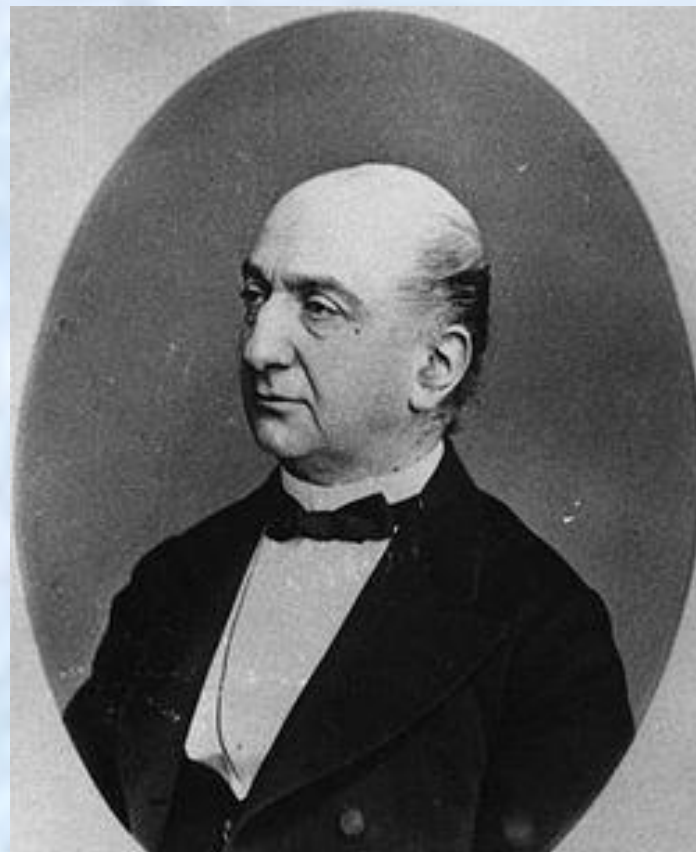
Иван Давыдович Делянов, министр народного просвещения России в 1882 – 1897 гг.