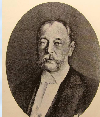
Д. А. Толстой

Новым министром внутренних дел был назначен консерватор, поборник сильной власти Дмитрий Андреевич Толстой , бывший министр просвещения в 1866 – 1880 гг.