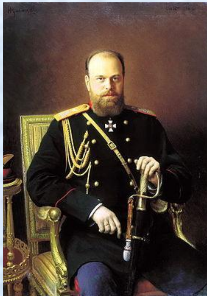
Император Александр III (1881 – 1894)