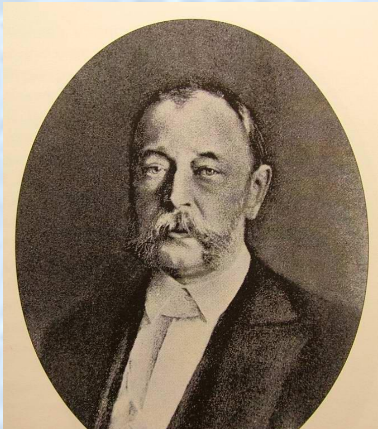
Дмитрий Андреевич Толстой, министр внутренних дел России в 1882 – 1889 гг.