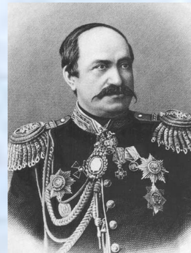
Н. П. Игнатъев

Николай Павлович Игнатъев также разрабатывал проект созыва совещательного Земского собора как истинно русского народного представительства. Но когда он попытался убедить в необходимости созыва Земского собора Александра III, император отправил его в 1882 г. в отставку.