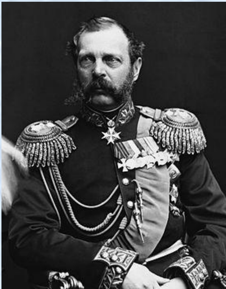
Император Александр II (1855 – 1881)