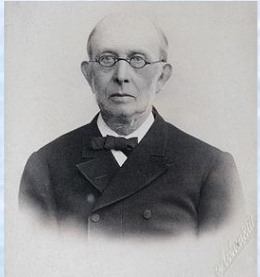
Константин Петрович Победоносцев , обер-прокурор Святейшего Синода в 1880 – 1905 гг.