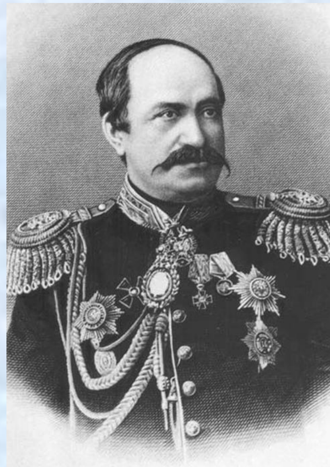
Министр внутренних дел России в 1881 – 1882 гг. граф Николай Павлович Игнатьев

Он разрабатывал проекты реформ местного самоуправления, в том числе крестьянского.