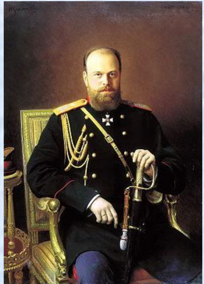
Император Александр III (1881 – 1894)