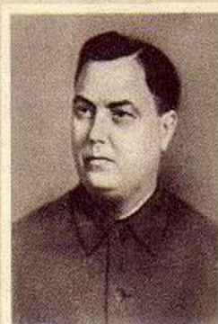
Г. М. МАЛЕНКОВ