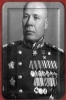
Семён Константинович Тимошенко

(потом была преобразована в СТАВКУ ВЕРХОВНОГО КОМАНДОВАНИЯ)