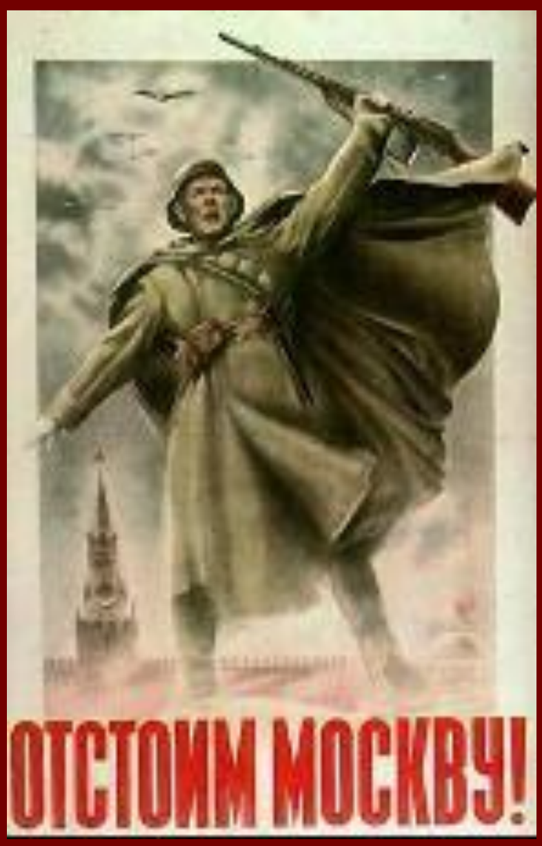
Плакат 1941 г.

Для захвата Москвы был подготовлен план «Тайфун» . Немцы попытались достичь на этом направлении троекратного превосходства в живой силе и технике. 30 сентября началось генеральное наступление.