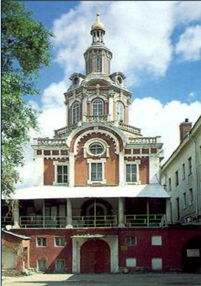
Московская славяно-греко-латинская академия.

В этом здании он в течение 3-х лет изучает науки, проводя все свободное от учебы время в библиотеке. Результат оказался впечатляющим - 5-летний курс был пройден за три года.