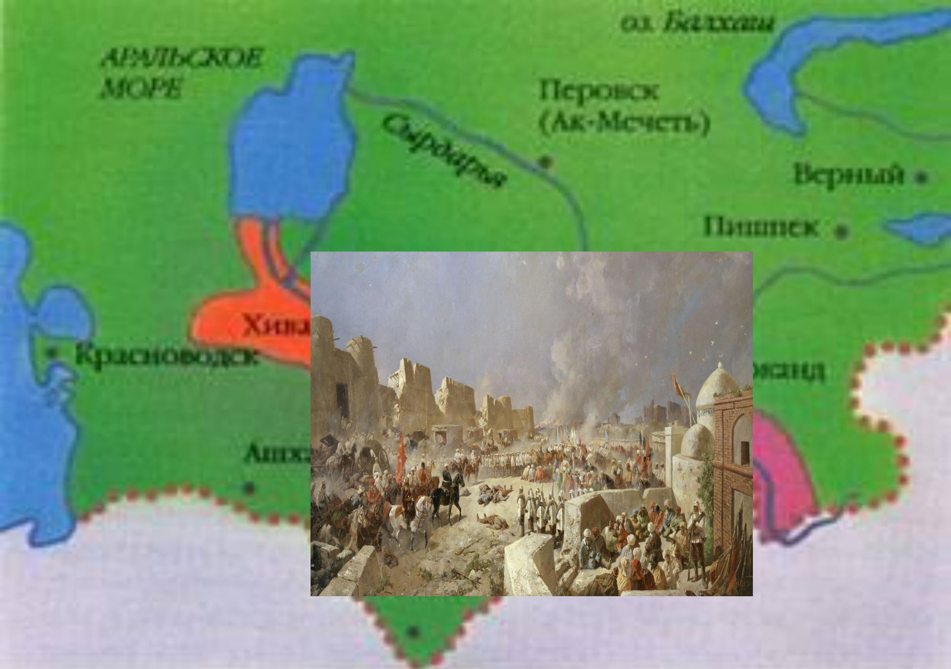
Средняя Азия в составе России