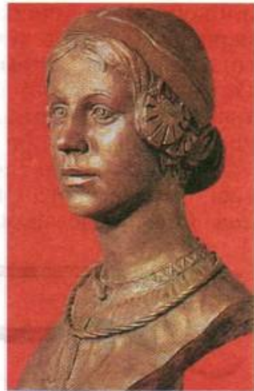
Женщина-славянка. Русский учёный М. М. Герасимов разработал способ восстановления облика древних людей по их черепам