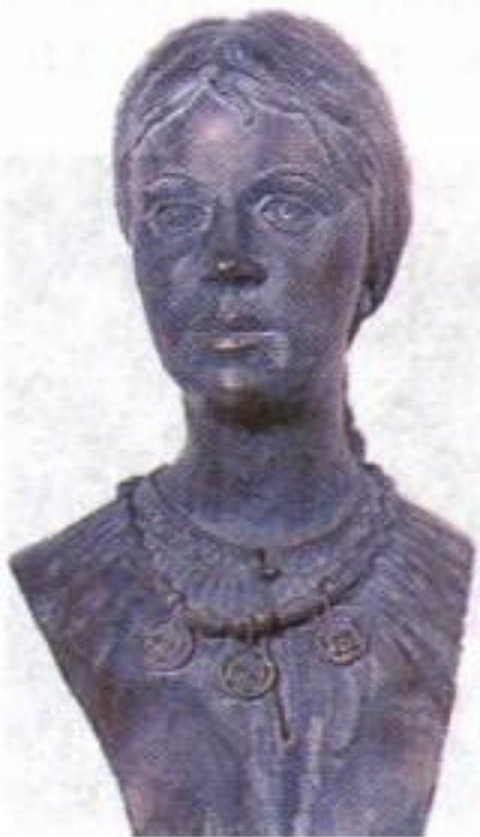
Женщина восточно-славянского племени вятичей