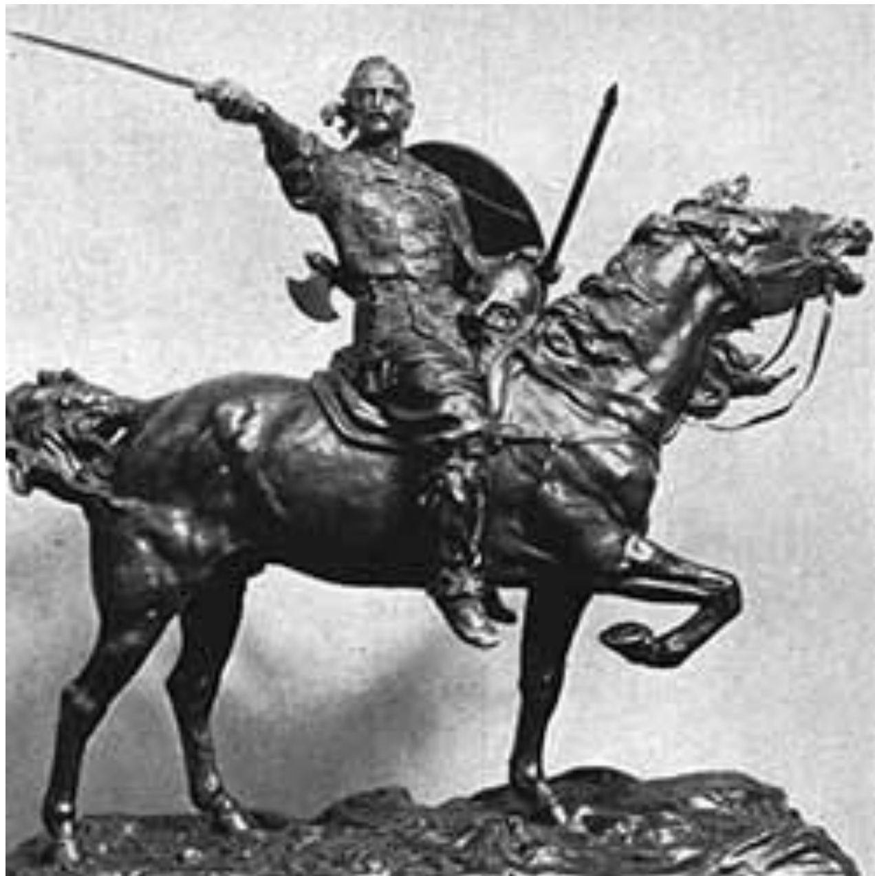
Князь Святослав. Скульптор Е. А. Лансере