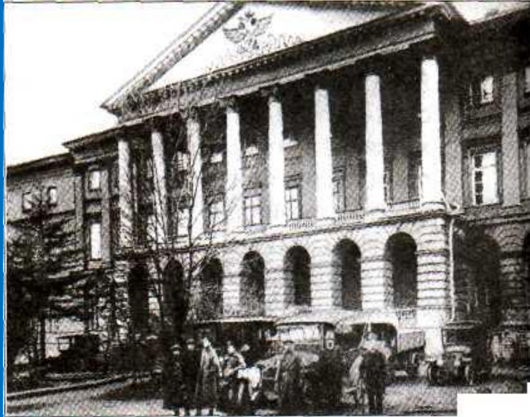
Петроград. Смольный. 1917г.

Причины: отсутствие твердой государственной власти; замедленный характер реформ; война; нарастание революционных настроений