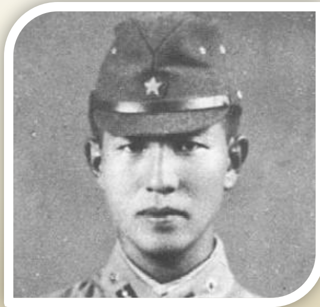
Онода Хиро, мл. лейт. Японской армии о. Лубанг

Кто и где вел партизанскую деятельность до 1974 года, не зная об окончании Второй Мировой войны?