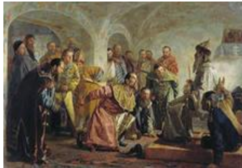
Но мы научены Христом не давать святое... Ответ Ивана Грозного Яну