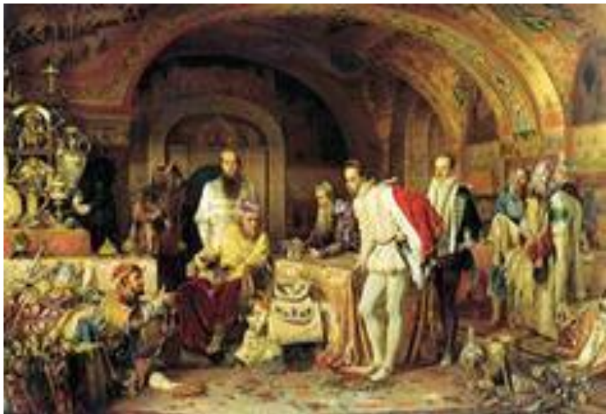
Вотчина Ивана Грозного.