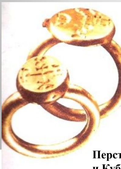
Перстень с печатью Органы и Кубрат- хана

К 80-м годам VI в. н.э. все болгарские племена были подчинены тюркам. В борьбе против поработителей началось сплочение болгарских племен, приведшее к созданию большого и сильного союза. В начале VII века (30-е годы) каганат распался и на территории между Черным и Каспийским морями образовались два государства — Хазарский каганат и Великая Булгария. Во главе этого союза стал князь Органа.