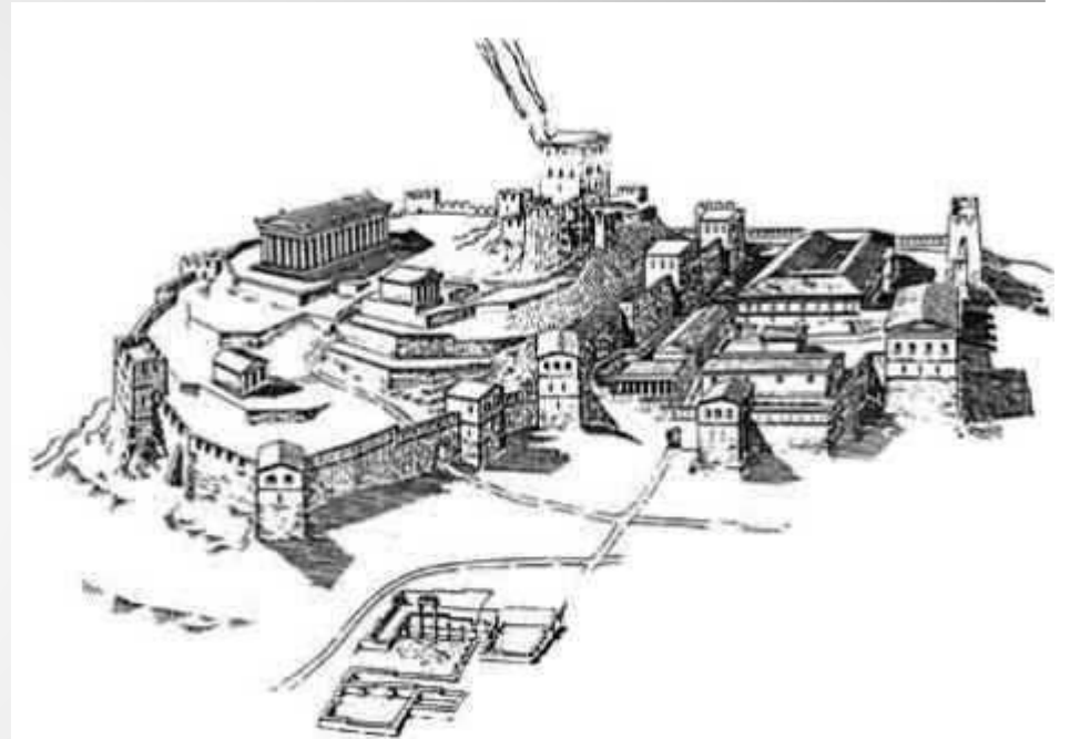
Фанагория - античный город на Таманском полуострове