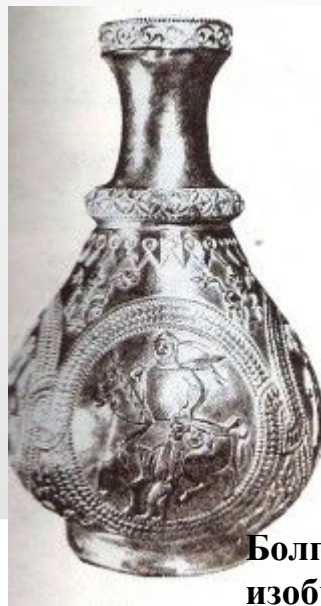
Болгарская ваза с изображением хана Кубрата