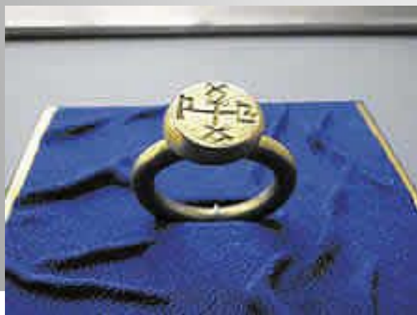
Перстень с печатью Кубрат– хана

Расцвет великой Булгарии пришёлся на время правления хана Кубрата (умер в 668 г.). Он окончательно разгромил тюрков и создал военно-политическое объединение, установив тесные связи с византийской империей.