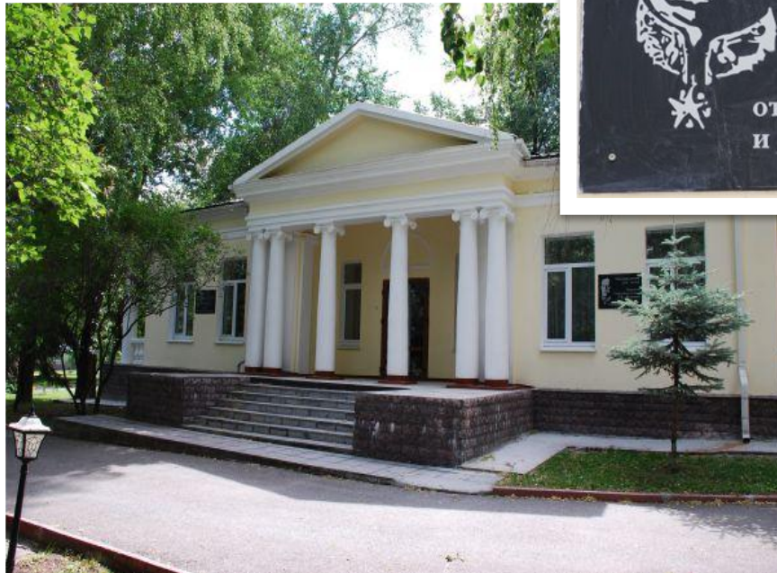
Дом Г. К. Жукова в Зеленой роще