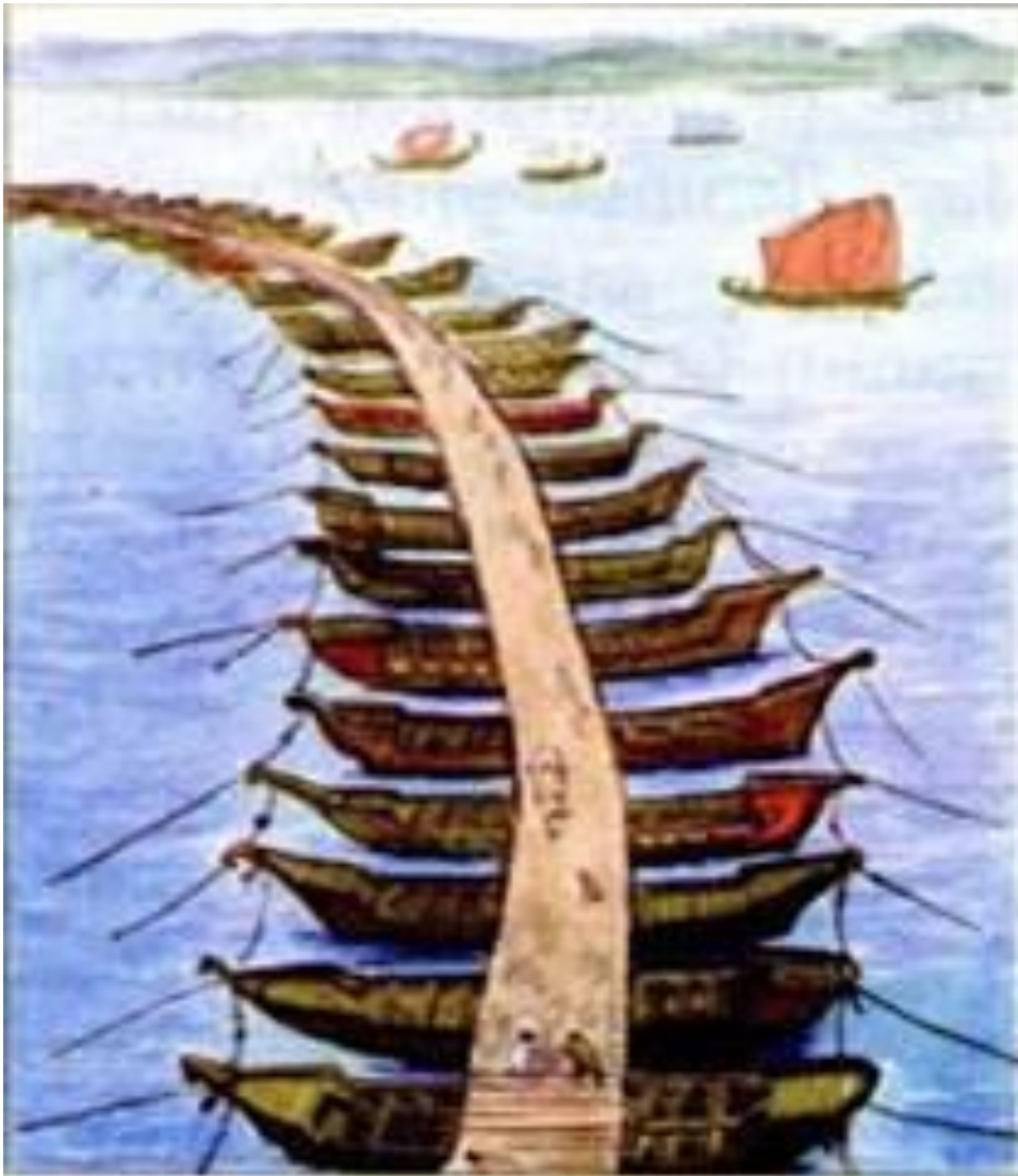
Понтонный мост Ксеркса