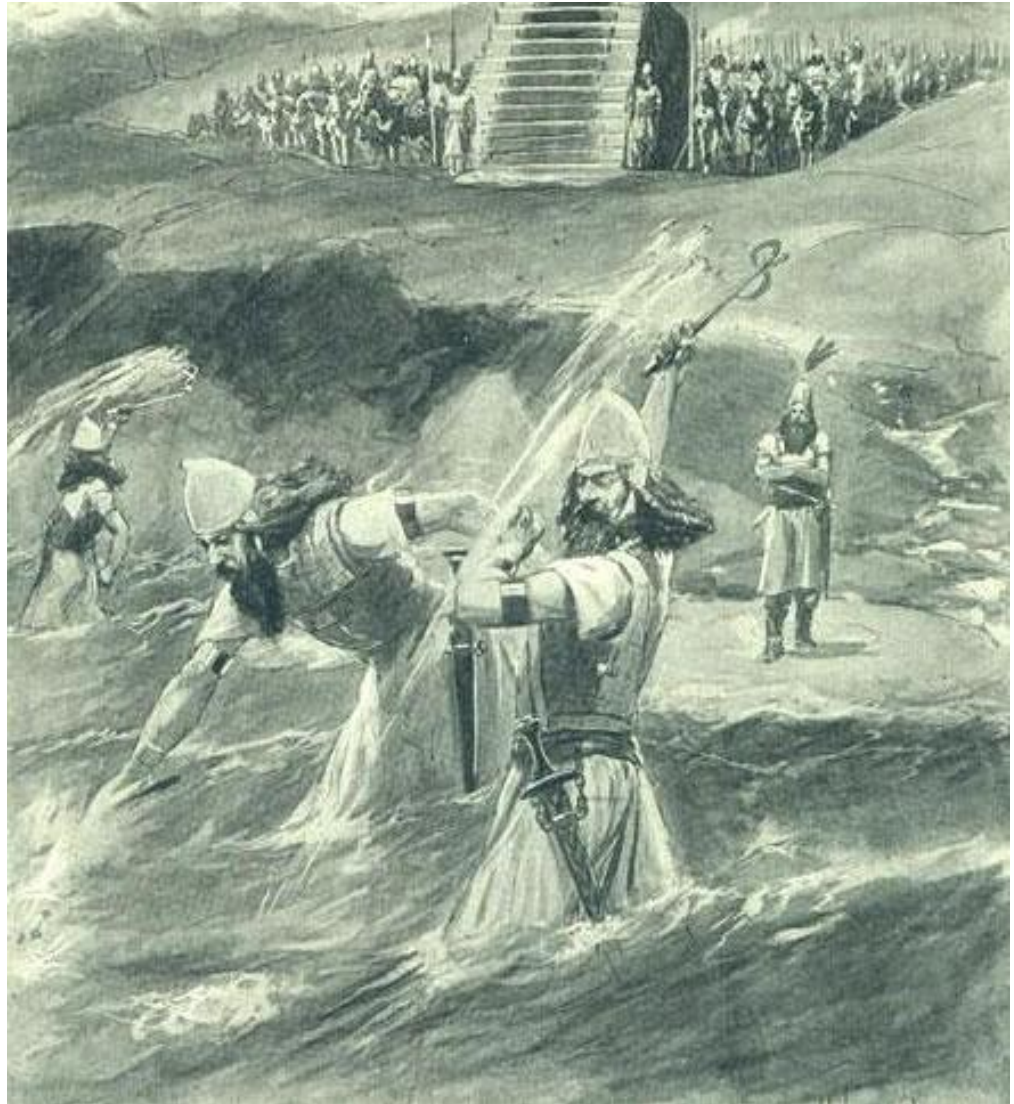
Ксеркс приказывает высечь море