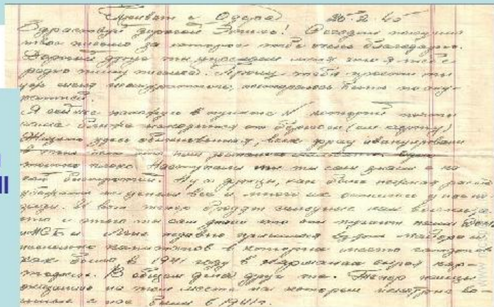
Письмо родным из Германии

Так же награждён медалью "За победу над Германией".