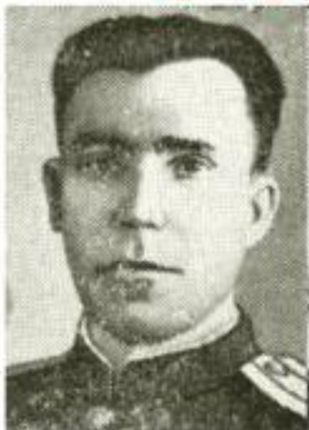
Командир 277-го стрелкового полка 175-й Уральско-Ковельской Краснознамённой стрелковой дивизии 47-й армии 1-го Белорусского фронта, майор.

Особо отличился в боях на территории Польши и Германии: форсировал реку Висла, два дня вел упорные бои за польскую столицу город Варшаву, мужественно и энергично руководил подчинёнными в ходе Висло-Одерской наступательной операции.