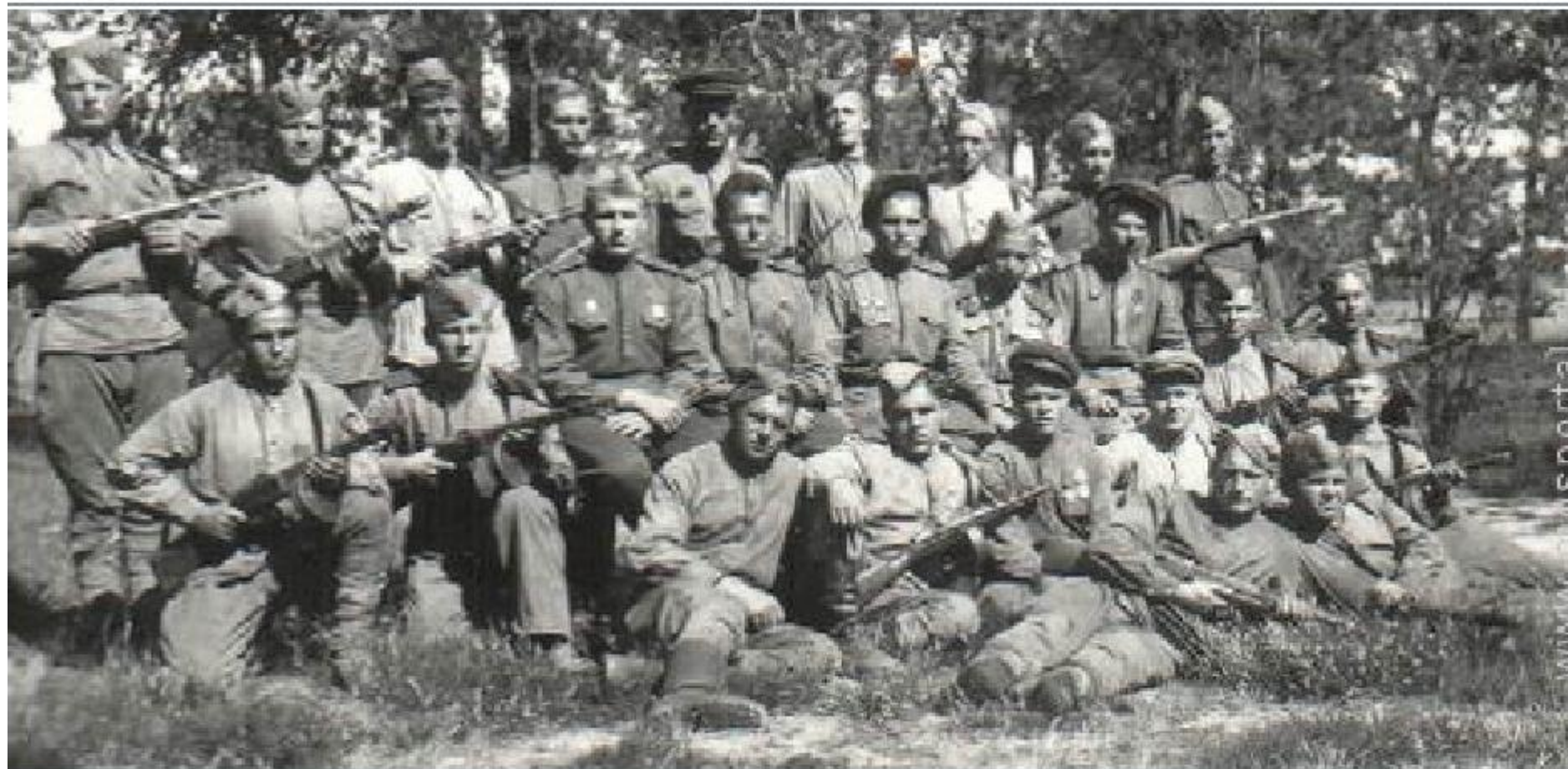
Друзья-однополчане. На обороте надпись: Август 1944 г. Польша, Радосць.