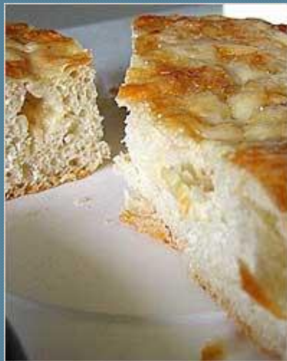
Сырный хлеб (тиропсомо)